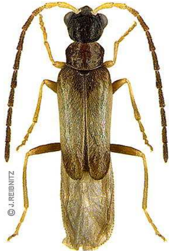
Abb. 1: Malthodes holdhausi.

Der Nachweis erfolgte im Rahmen der Erforschung des Hundsbachtales durch die Arbeitsgemeinschaft Rheinischer Koleopterologen (HADULLA & WAGNER 2016). Naturschutzfachlich und faunistisch ist das Hundsbachtal als Forschungsziel doppelt lohnenswert. Seit dem Jahr 1948 ist es als Naturschutzgebiet ausgewiesen und wird seitdem forstlich nicht mehr genutzt, so