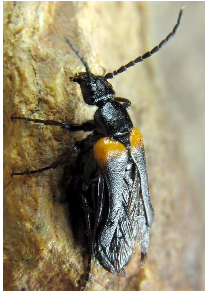
Abb. 1: Sitaris muralis an einer Hauswand.

Abstract: New records of the blister beetles Sitaris muralis (FOERSTER, 1771) and Stenoria analis (SCHAUM, 1859) from the Mittelrhein near Sinzig are presented. The german distribution, proofs by Triungulinus larvae at the host bees and more ecological details are discussed.