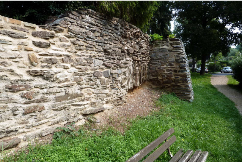
Abb. 3–8 (vorige Seite v.o.l.n.u.r.): Fundpunkte des Ölkäfers Sitaris muralis im Stadtgebiet von Sinzig und in Sinzig-Westum (alle Fotos SCHÖNFELD 2015–2018) und Abb. 9 Fundpunkt 8 an der Südseite der alten Stadtmauer (Foto SCHÖNFELD 2017).

Fundpunkt 8 – Südseite der alten Stadtmauer im Bereich Rheinstraße und Kreisel (50.541006°, 7.248667°, Abb. 4): 27.VIII.2017, 12:15 Uhr, 1 ♀ alttot, ca. 3 m entfernt fliegende Bienen (ZFMK).