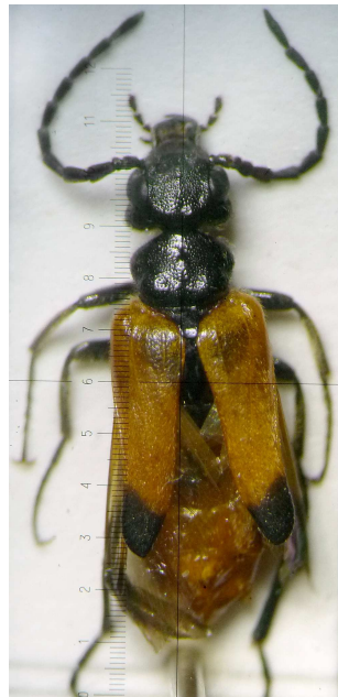
Abb. 10: Beleg des rheinischen Erstfundes von Stenoria analis aus Sinzig-Westum.

Mit der Ausbreitung des Wirtes, der Efeu-Seidenbiene ( Colletes hederæ ; SCHMIDT & WESTRICH 1993) auf mittlerweile 15 europäische Staaten wurde Deutschland seit 1991 und Rheinland-Pfalz seit 1994 – hier jetzt weit verbreitet – besiedelt. Über das Mittelrhein-