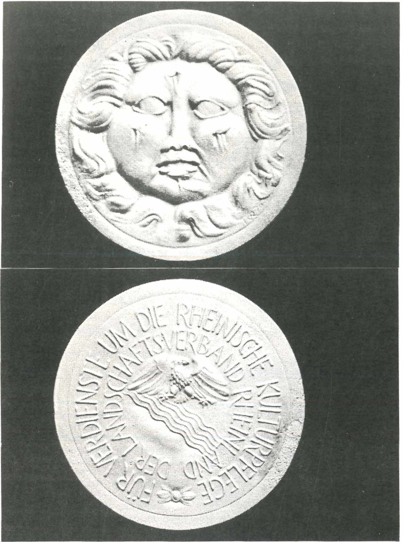
Vorder- und Rückseite des Rheinlandtalers