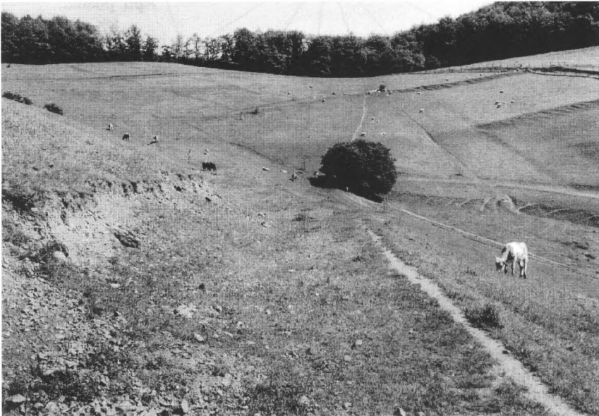
Abb. 2: Blick von der Sammelfläche 2 auf die Sammelfläche 1 (links oben). Die bewaldete Sammelfläche 3 befindet sich ca. 200 m rechts des Hohlwegs am rechten oberen Bildrand.

Von 14. April 1992 bis 31. März 1993 wurden jeweils etwa zum 1. und 15. eines Monats Kuhfladen und Schafsköttel von allen drei Flächen getrennt gesammelt und im Labor mit Wasser übergossen. Zur Wasseroberfläche flottierende Käfer wurden abgesammelt, lebend determiniert oder im Zweifelsfall mit Scheerpeltz-Lösung (65 % Ethanol, 5 % Essigsäure und 30 % Aqua dest.) fixiert und unter der Stereolupe determiniert (Determinations- und Nomenklatur nach KRELL & FERY 1992, bzw. MACHATSCHKE 1969 und VOGT 1971). Lebend determinierte Individuen sowie solche von in dieser Studie unberücksichtigten Käferfamilien, wurden mit Dung verproviantiert und spätestens am nächsten Tag zur Schelinger Viehweide zurückgebracht.