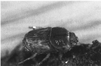
Abb. 4: Eines von nur 2 aufgefundenen Exemplaren Euonicellus fulvus (Länge ca. 10 mm). Erster Wiederfund für Deutschland seit 1935 (Photo: Coch, Inst. f. Landespf. 1993).

Nach HORIZON (1958) eine kontinentale (pontisch-mediterrane) Art, die den Bereich des atlantischen Klimas meidet (Abb. 4). Seit 1935 kein neuer Fund in Deutschland gemeldet. Letzter Fund stammte vom Lilienhof/Kaiserstuhl, wo die Beweidung in großem Stil seit Jahrzehnten aufgegeben wurde. Letzter regional benachbarter Fund im Ausland: 1951 aus dem Elsaß (GANGLOFF 1991). 1 Exemplar wurde am 16. 9., das andere am 1. 10. 1992 in frischem Rinderdung im Hessental gefunden. Eine stenotope, xero- und thermophile Art, die aus sehr weichem und fast flüssigem Pferde-, Rinder- und Schafskot gemeldet wird (KOCH 1989). Rote Liste für Deutschland (GEISER et al. 1984): Klasse 1 (vom Aussterben bedroht). Rote Liste für Bayern (GEISER 1992): Klasse 0 (ausgestorben oder verschollen!).