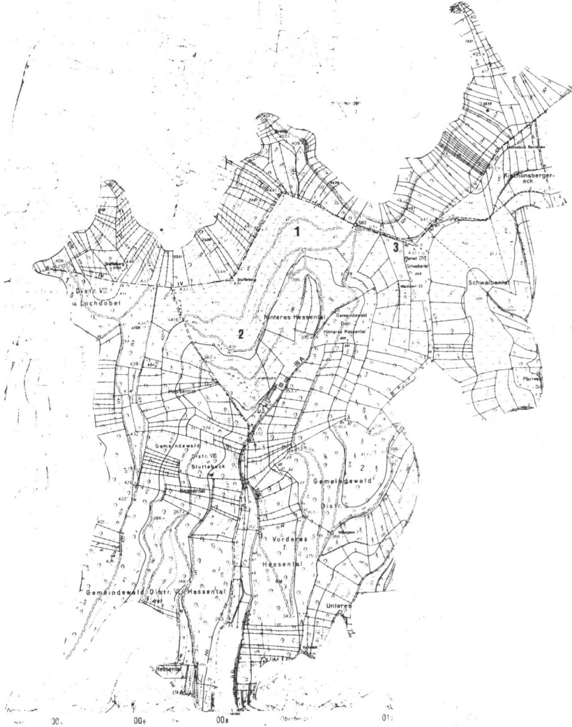
Abb. 1: Hesselental und oberes Schwalbental mit den Untersuchungsgebieten 1, 2 und 3. Ausschnitt aus der Deutschen Grundkarte 1:5.000 hier stark verkleinert (Repro: Marx, Inst. f. Landesplf. 1993).