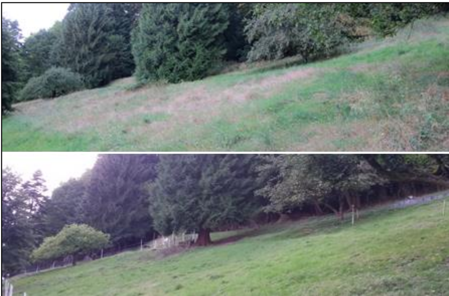
Abb. 7: Foto August 2016 (oben) und August 2017; gut zu erkennen ist die durch die Weidetiere schon nach einem halben Jahr markant herausgestellte „Fraßkehle“, also das Abweiden der Bäume bis auf Äserhöhe am Waldrand, und die abgestorbenen Gräser, die im Vorweidejahr noch flächig vorhanden waren, nach der Beweidung aber fehlen.

Auf Basis der Voruntersuchungen wurde mit Unterstützung des Flächeneigentümers (Caritas Deutschland) ein Lehrforschungsprojekt „Weide am Schlossberg“ initiiert. Seit April 2017 sind fünf Ziegen (Tauernschecken) und drei Schafe (Waldschafe) während der Weidesaison im Einsatz und beweiden neben dem Offenland noch etwa 0,4 ha Wald (Abb. 7).