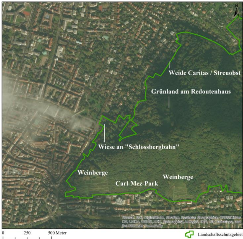
Abb. 1: Luftbild des Schlossbergs in Freiburg mit den behandelten Offenlandlebensräumen.

für Standorts- und Vegetationskunde gewonnen wurden. Frühere Veröffentlichungen aus den Mitteilungen des Badischen Landesvereins für Naturkunde und Naturschutz gehen auf Flora und Fauna des Schlossbergs ein und ermöglichten einen Abgleich mit der heutigen Artenausstattung.