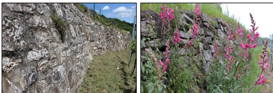
Abb. 5: Verfügte Mauern (links) sind als Lebensraum für Reptilien nicht / bedingt geeignet; eine südexponierte, hohlraumreiche Trockenmauer, hier mit Löwenmäulchen ( Antirrhinum majus ) (Gartenflüchtling), ist als Lebensraum ideal.

Teils sind typische Wiesen-Arten vorhanden wie Wiesen-Flockenblume ( Centaurea jacea ), Feld-Witwenblume ( Knautia arvensis ) und vereinzelt Großer Wiesenknopf ( Sanguisorba officinalis ). Punktuell kommen auch Weidezeiger wie der Besenginster ( Cytisus scoparius ) vor. Feld-Hainsimse