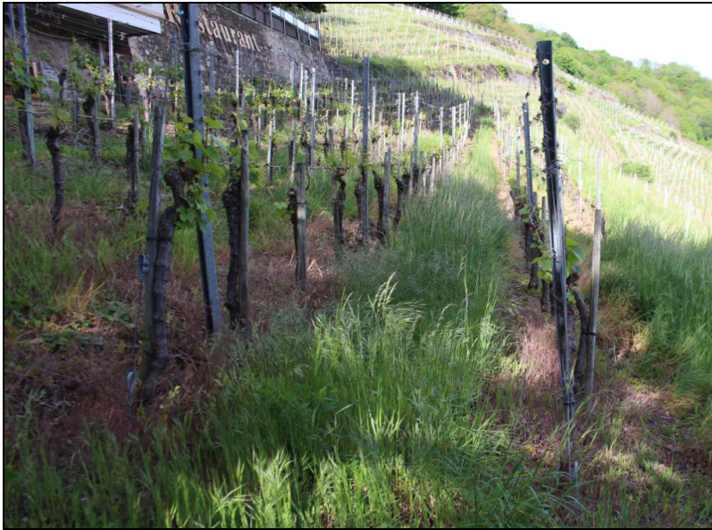
Abb. 3: Der Weinbau beschränkt sich heute auf den Südhang des Schlossbergs. Die Reben sind schwierig zu bewirtschaften. Unter den Rebstöcken ist der Herbizideinsatz zu erkennen. Zwischen den Zeilen nimmt die Taube Trespe ( Bromus sterilis ) im Frühjahr große Flächenanteile ein.