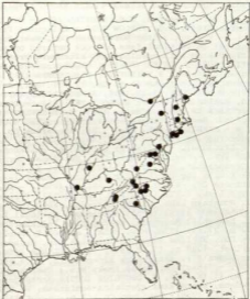
Karte 3: Verbreitung von Porpidia albocerulescens im atlantischen Nordamerika aufgrund Überprüfter Belege. Die Art ist in diesem Gebiet sehr verbreitet. Ihr nordamerikanisches Areal dürfte wesentlich größer sein, als durch diese Punkte abgesteckt.