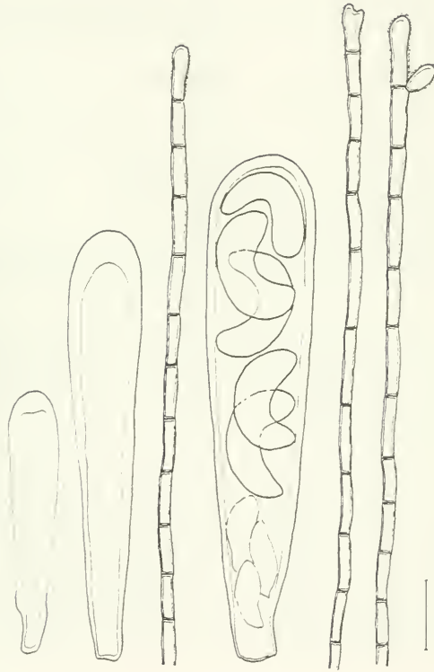
Abb. 1 Junge und reife Asci und Paraphysen von Schaereria fabispora . (Länge des Maßstriches: 10 \mu\text{m} )