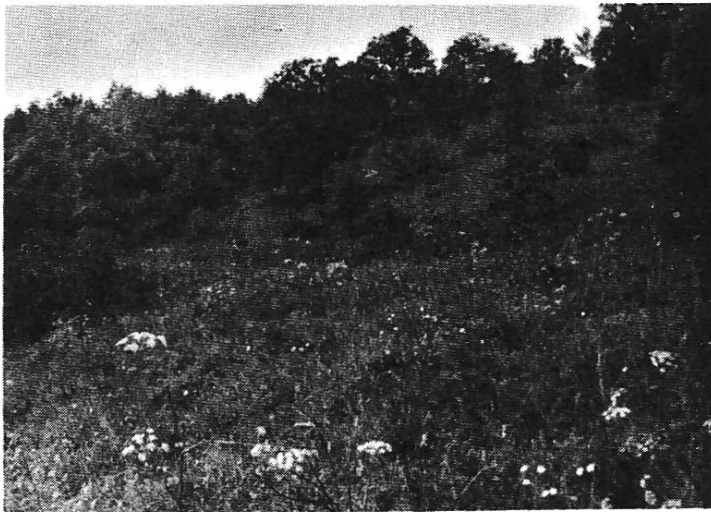
Flaumeichen-Buschwald, Lebensraum von Saga pedo Pall.

Um ihren Lebensraum grob zu kennzeichnen, mögen einige Pflanzen erwähnt werden, die ihre Biotopgenossen sind, z.B.: Dictamnus albus L., Onosma echioides L., Stipa pennata L., Anemone pulsatilla L., Aster montanus Allioni ( alpinus L.), Chrysocoma linosyris L., Allium flavum L., Rhamnus saxatilis L., Prunus fruticosus Pall., Pr. mahaleb L., Amelanchier ovalis Med. etc.