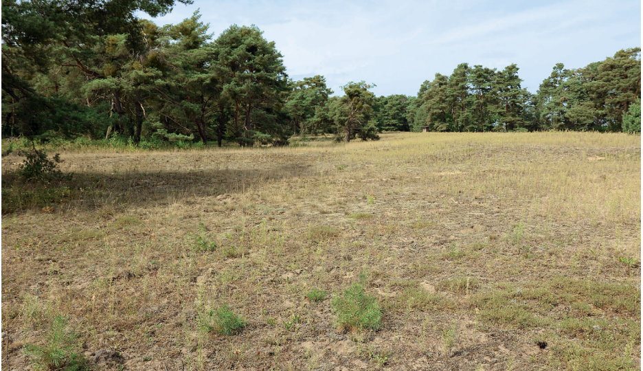
Abb. 2: Habitat von Stenoria analis auf der Pflege Schönau bei Sandhausen. Es handelt sich um einen lückigen Sandrasen auf Resten der Binnendünen in den Hardtebenen am Oberrhein.