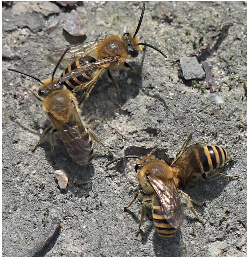
Abb. 1: Efeu-Seidenbienen in der Brutkolonie in der Schwetzingener Hardt, 27.8.2015.