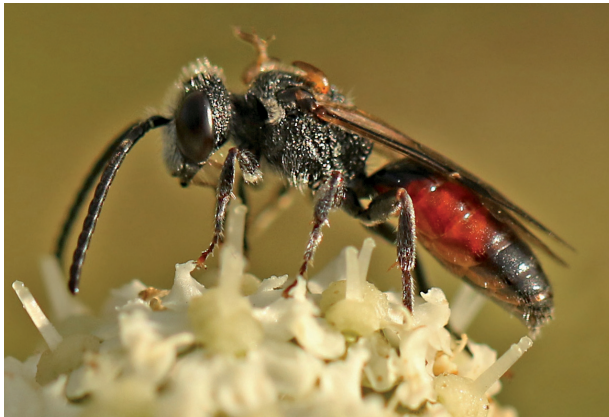
Abb. 7: Männliche Blutbiene ( Sphecodes spec. ) beim Blütenbesuch auf Peucedanum cervaria , Michaelsberg, Untergrombach, 3.9.2016. Man erkennt mindestens 2 Triunguli auf dieser Biene.

Faszinierend ist die koordinierte zeitliche Abfolge der Vorgänge: Auftreten der Imagines des Käfers im frühen August, Paarung und Eiablage, Entwicklung der Triunguli bis zum Schlupf innerhalb von ca. 15-16 Tagen.