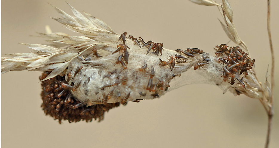
Abb. 8: Larvencluster von Stenoria analis mit geschätzten 200 Triunguli an einem trockenen Grasstängel. NSG Zugmantel Bandholz, 10.9.2016.