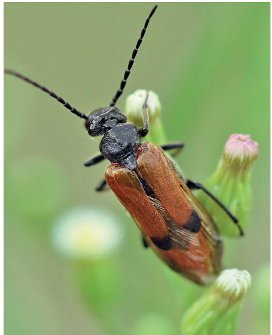
Abb. 3: Eiablage von Stenoria analis auf Kanadischem Berufkraut, Pflege Schönau (Binnendüne Sandhausen), 13.08.2016. Abb. 4: Zweites Exemplar auf derselben Pflanze wie in Abb. 3, 13.8.2016.