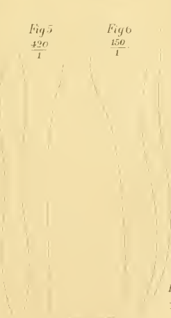
Fig 7 \frac{420}{1}