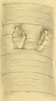
Fig 4 \frac{8}{1}