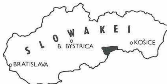
Abb. 1: Lage des Untersuchungsgebietes

dar, die sich in Höhen von 500 bis 800 m ü.M. befinden und durch steile, 200 bis 400 m hohe Abhänge von Cañons sowie auch von den benachbarten Becken getrennt sind. Es geht um die Koniarska planina, Plešivská planina, Silická planina, planina Horného vrchu, Dolného vrchu, Zádielska planina und Jasovská planina.