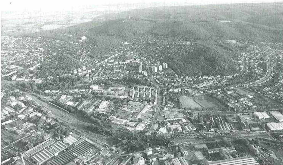
Abb. 2: Der westliche Teil von Ódenburg. Im Vordergrund Industriestandorte; in der Mitte die Wohnsiedlungen in der Ibolya utca und in der Felsőlővér út, rechts Wandorf [Sopronbánfalva]