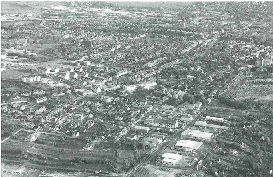
Abb. 3: Der nördliche Teil von Ódenburg. Im Vordergrund die Gewerbezone Nord; in der Mitte neue Wohngebiete von Arany-hegy; rechts die St.-Michaelis-Kirche [Szent Mihály templom]