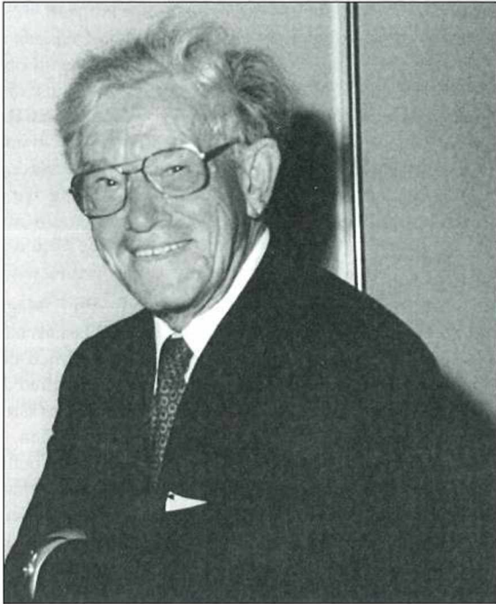
Franz FLIRI – 1918–2008

Finnland und Frankreich mitgemacht und erst nach dem Krieg das Studium, zuerst mit dem Lehramt 1946, dann mit dem Doktorat 1947, an der Innsbrucker Universität abgeschlossen. 3) Bei der im Rahmen der bevölkerungsgeographischen Schule von Hans KINZL 4) entstandenen Dissertation über „Bevölkerungsgeographische Fragen im Unterinntal: Baumkirchen, Fritzens, Gnadewald und Terfens“ verwendete FLIRI erstmals bei dieser Thematik mathematisch-statistische Verfahren und Methoden der prüfenden Statistik und gelangte damit zu einem Arbeitsstil, den er im Laufe seines langen wissenschaftlichen Lebens beibehalten und weiterentwickelt hat. Hervorhebung verdient, dass FLIRI nochmals mit fast 80 Jahren auf die Thematik seiner Dissertation zurückgekommen ist und sich die Mühe gemacht hat, die Ergebnisse der zum Teil ungedruckten Dissertationen und Hausarbeiten der KINZL-Schule aus den schwierigen Jahren der Kriegs- und der unmittelbaren Nachkriegszeit zusammenzufassen und zu veröffentlichen. 5)