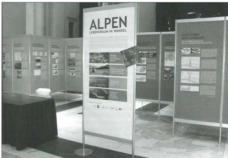
Abb. 2: Erste Präsentation der Ausstellung in der Aula der Universität Wien, Ende Oktober 2011