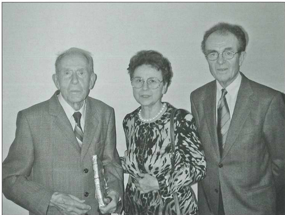
Abb. 3: Expertentreffen zum 100. Geburtstag von Leonhard BRANDSTÄTTER im Palais Meran in Graz am 20. November 2006; v.l.n.r. Leonhard BRANDSTÄTTER, Ingrid KRETSCHMER, Gerhard BRANDSTÄTTER

Um sich ganz seinem geplanten Buch widmen zu können, legte Leonhard BRANDSTÄTTER im Jahr 1976 seinen Lehrauftrag für topographische Kartographie an der Technischen Universität Graz zurück. Jahrelange Erfahrung mit Gebirgskartenblättern, die praktischen Beispiele aus der Alpenvereinskartographie und exakte, logische und belegbare theoretische Überlegungen stellten die Ausgangssituation für dieses Buch dar und sollten in einer umfassenden Publikation niedergelegt werden. Das Buch „Gebirgskartographie. Der topographisch-kartographische Weg zur geometrisch integrierten Gebirgsformendarstellung, erläutert an alpinen Beispielen“ erschien im Jahr 1983 (vgl. BRANDSTÄTTER 1983).