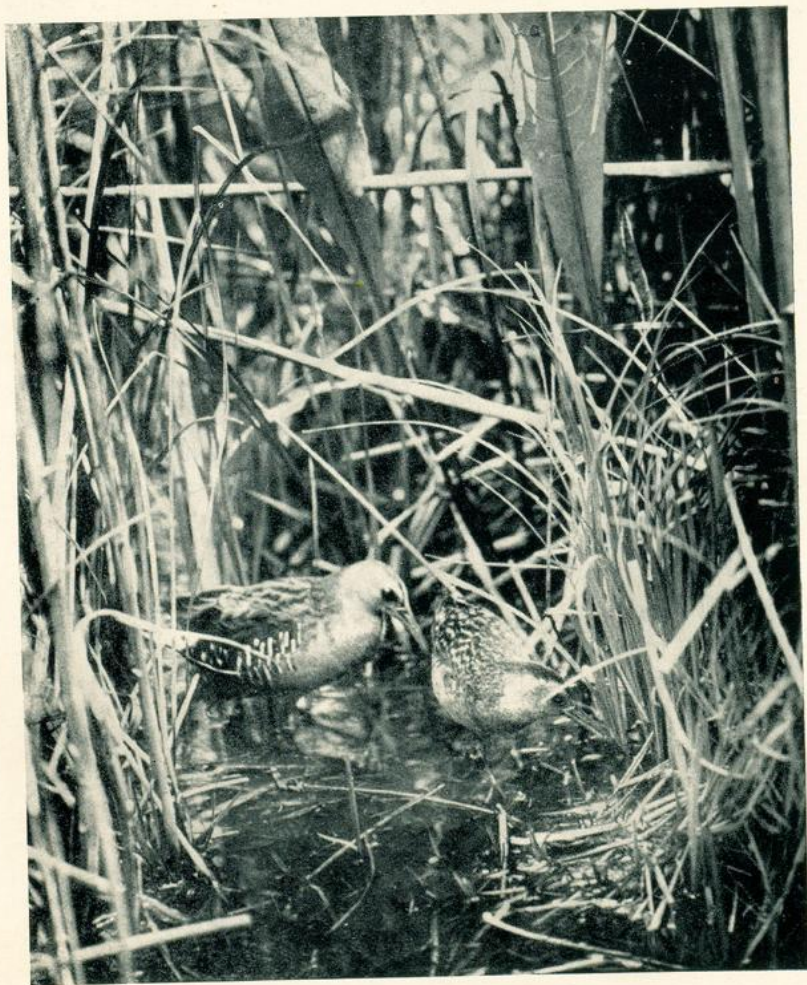
Wasserralle, Rallus a. aquaticus L. Pärchen am Nistplatz, das ♀ im Begriff, auf das Nest zu gehen Königswartha (Sa.), Mai 1936