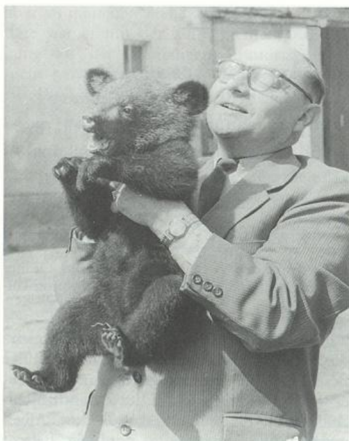
Abb. 6. Strahlender Direktor präsentiert den im Tierpark geborenen Kragenbär (kurz vor dem Mauerbau, 4.5.1961).