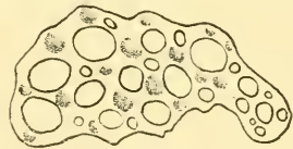
Fig. 17. Kalkkörper von Colochirus pusillus n. sp.

Kalkkörper treten wie bei allen Colochirus -Arten auch hier massenhaft und in verschiedenster Gestalt auf. Ähnliche, ich möchte wohl sagen dieselben Gebilde, sind für andere Colochirus -Arten bekannt, und ich kann daher auf solche verweisen. Trotzdem war es mir nicht möglich, eine Form zu finden, bei der die Kalkkörper in derselben Zusammenstellung vorkommen und gleichzeitig die Beschreibung der äußeren Merkmale mit dem mir vorliegenden Exemplar übereinstimmt. Von Kalkgebilden sieht man zunächst viele längliche, glatte Platten, wie sie Théel 1) (Taf. IV, Fig. 9a) für Colochirus pygmaeus gezeichnet hat, ferner Platten von verschiedenster Breite und Länge, die mehr oder weniger dicht mit Knoten besetzt sind, nach einer Seite aber stets in eine nicht knotige, durchlöchernte, glattrandige Scheibe auslaufen (Fig. 17). Ähnliche Kalkkörperformen sind bei vielen Cucumaria -Arten beschrieben, aber dann meistens auch der Fortsatz mit Knoten oder Stacheln besetzt und am Rande ausgezackt (vgl. z. B. Ludwig 2) , Taf. II, Fig. 25a, b, e, f). Ferner finden sich Kalkkörper, die einen x-förmigen Stab als Grundlage haben und dann die Form annehmen, wie sie von Marenzeller 3) (p. 132) für seinen Colochirus inornatus beschreibt, dann Platten, die man sich als übriggebliebene Basis eines Stühlchens denken könnte, neben 4 größeren Löchern dazwischen kleinere anweisen. Solche