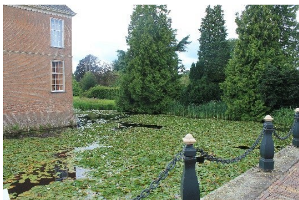
Schloss Slangenburg