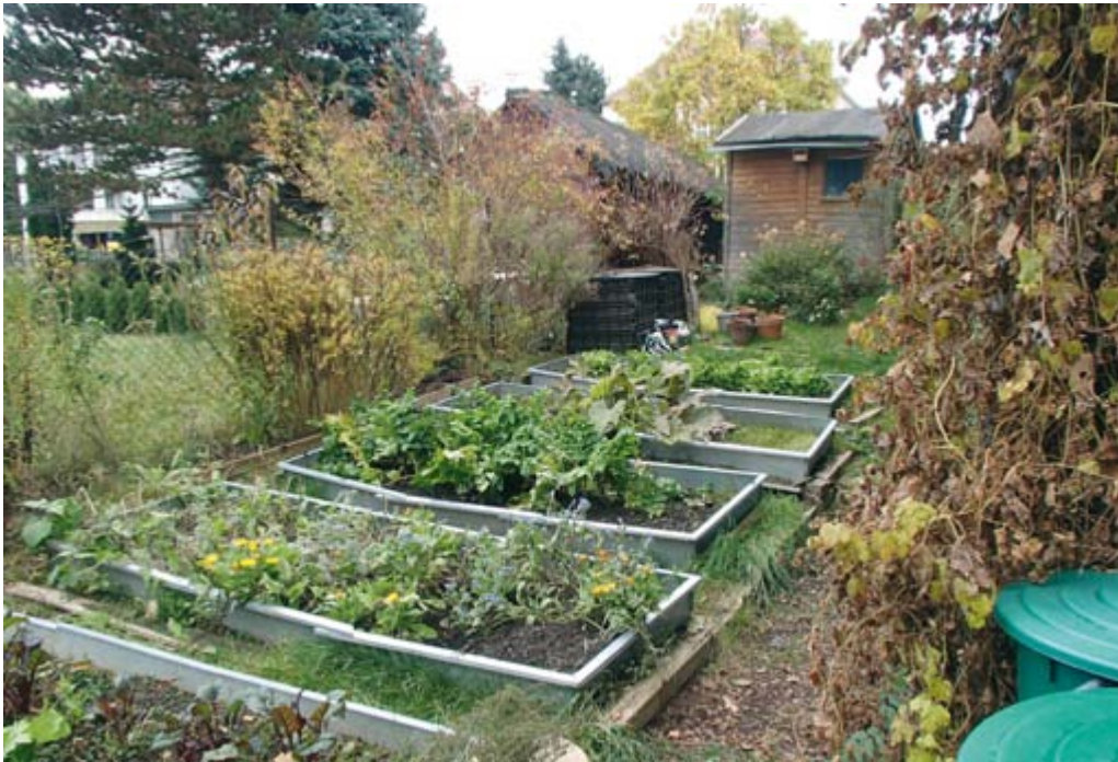
Abb. 3: Fundort von Hygromia cinctella in Zittau, Sachsen

Beim Fundort handelt es sich um einen ca. 800 m 2 großen Hausgarten mit Rasenfläche, Staudenrabatten, Gemüsebeeten sowie naturnahen Hecken und Ufersaumbereichen eines angrenzenden Mühlgrabens. Bei der Ernte von Gemüse (Wirsing) wurden am 19.11.2012 zwei Exemplare von Hygromia cinctella gefunden. Am 28.11.2012 saß ein weiteres in einem Salatkopf, später wurden vier Tiere im Bereich der Gemüsebeete gefunden. Alle bis dahin beobachteten Exemplare waren mit ca. 8 mm Breite noch nicht voll ausgewachsen.