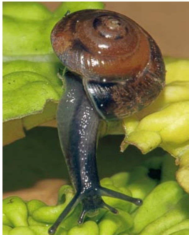
Abb. 1: Das erste in Sachsen nachgewiesene Exemplar von Hygromia cincitella

In Deutschland wurde Hygromia cincitella erstmalig 1995 von M. FALKNER auf einer Ruderalfläche bei Kelheim gefunden (FALKNER 1995). Zahlreiche neue Beobachtungen in den folgenden Jahren bis 2006 zeigten eine punktuelle Ansiedlung der Art im Süden und Westen Deutschlands (BECKMANN & KOBIALKA 2008). Für die nördlichen und östlichen Bundesländer waren bis zur Bestandsaufnahme von BECKMANN & KOBIALKA im Jahr 2006 keine Fundorte bekannt. 2008 gab es einen ersten Nachweis in Rostock (GÖLLNITZ 2008). Der vermutlich zu Zittau nächstgelegene bekannte Fundort befindet sich in Prag, wo Hygromia cincitella im Jahr 2010 gefunden wurde und ein Jahr später bestätigt werden konnte (ŘÍHOVÁ & JUŘIČKOVÁ 2011). Aus dem von Zittau nur wenige Kilometer entfernten Nachbarland Polen wurde noch kein Nachweis bekannt.