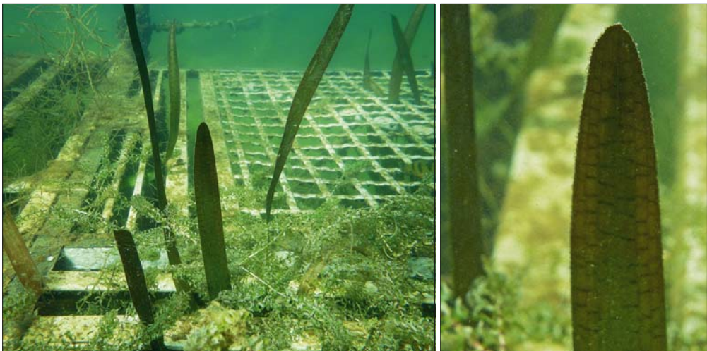
Abb. 2, 3: Vallisneria spiralis im Gremminer See, 14.8.2012

Die Vorkommen von Vallisneria spiralis befinden sich am Westufer im Bereich einer Ausbildungsplattform für Taucher (Abb. 2, 3) in Tiefen von > 4 m.