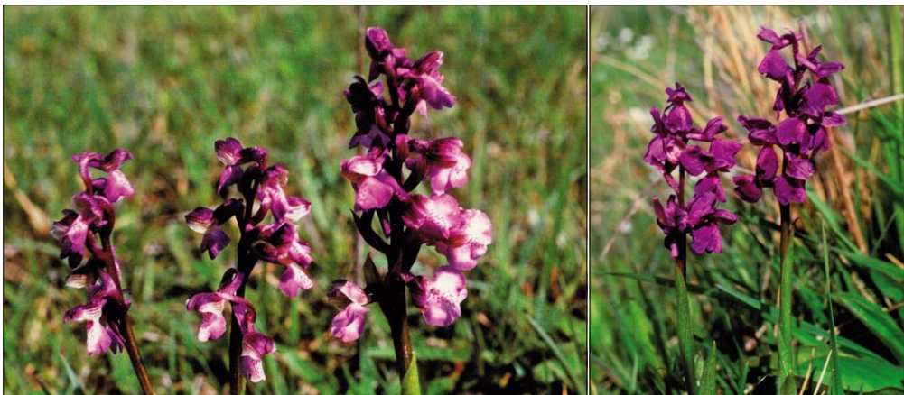
Abb. 2 u. 3: Orchis morio am Fundort Salzwedel-Hoyersburg, 10.5.1993.

Um die Restpopulation zu retten, wird die Fläche neuerdings entsprechend dem Artenhilfsprogramm mit Rindern beweidet. Vielleicht gelingt es dadurch, das einzige Vorkommen im Altmarkkreis Salzwedel zu erhalten und die Individuenzahl wieder zu vergrößern.