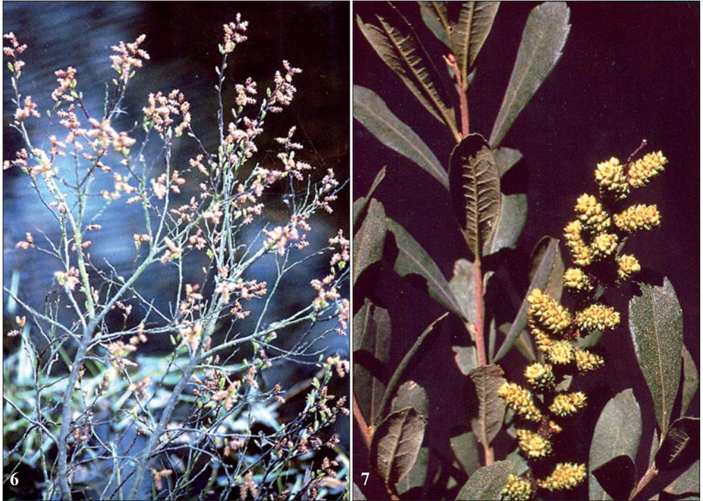
Abb. 6–7: Myrica gale. – 6: Blühendes männliches Exemplar. Fundort 3 (s. S. 33). 06.05.2006, – 7: Fruchtendes Exemplar. Fundort 3 (s. S. 33). 18.07.1992

4 ha großes Feuchtgebiet, heute größtenteils verbuscht bzw. bewaldet, erhalten geblieben. Am südöstlichen Rand des einstigen Moors (auf der Karte 1:10 000 als Judenfriedhof bezeichnet), konnte 2001 aber noch ein rezentes Vorkommen von Myrica gale nachgewiesen werden (vgl. Fundort 4), das möglicherweise als Relikt der einstigen Besiedlung zu werten ist.