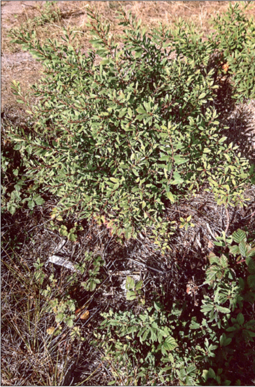
Abb. 1: Myrica gale, dreijährige Stockausschläge. Fundort 4 (s. S. 33), Teilansicht. 18.09.2019