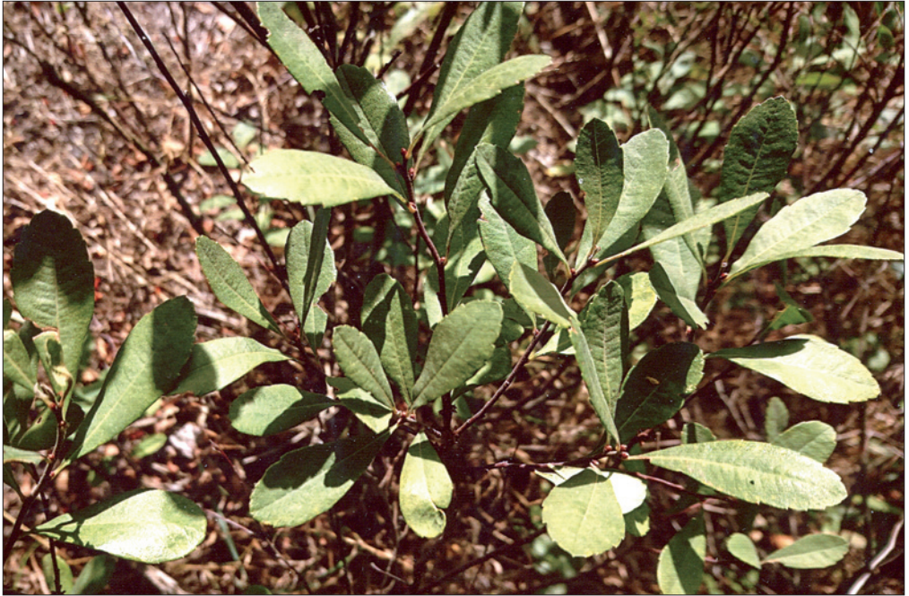
Abb. 2: Myrica gale, belaubte Triebe. Fundort 4 (s. S. 33). 18.09.2019

er an, dass „des Hopfens harzige Teile viel weniger schaden“, als die des Hanfes und „auch zum Getränke viel dienlicher sind als der Gagel, den man sonst in Schweden dazu brauchte, welcher viel Kopfschmerzen verursachte; ich sage nichts von Enzian, Bitterklee und Wermut, welche die Armen zuweilen statt des Hopfens brauchen“ (LINNÉ 1749).