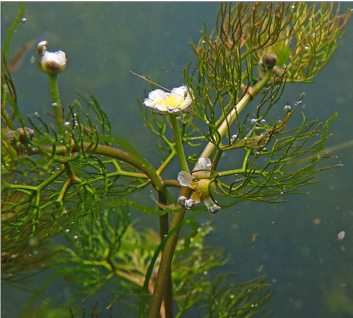
Abb. 2: Ranunculus rionii, Blütenstand. Talsperre Kelbra, 13.06.2019