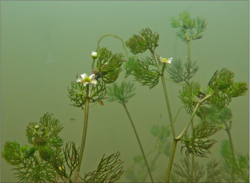
Abb. 1: Ranunculus rionii, Habitus. Talsperre Kelbra, 13.06.2019