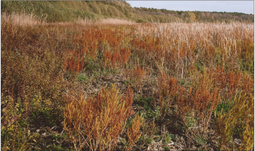
Abb. 9: Trockengefallener und abgestorbener Röhrichtgürtel am Nordufer des Arendsees; im mittleren Bereich Folgevegetation mit Lycopus europaeus , Rumex maritimus u. a., 11.11.2020.

Der in den Flachwasserbereichen entstandene Schilfgürtel wies auch vor 2018 eine geringere Dichte als am Südufer auf. Inzwischen ist er nicht nur schütterer geworden, sondern fehlt an vielen Stellen bereits fast vollständig. Seine Wuchsorte werden jetzt von Gehölzen, vor allem Erlen, eingenommen. Diese bilden einen geschlossenen Saum und beginnen den angrenzenden Erlenbruchwald seewärts zu erweitern. Selbst inmitten des ehemaligen Rohrkolben-Röhrichts ist im Abschnitt H ein Streifen aus Alnus glutinosa und Betula pendula entstanden. Landseitig schließt sich eine Zone mit dichter krautiger Vegetation und etlichen Pinus sylvestris -Sämlingen an. Im Abschnitt G haben sich sogar kleinflächige Herden von Calamagrostis epigejos angesiedelt, auch Senecio inaequidens (wenige Ex.) ist neben S. vernalis und S. vulgaris vertreten. Auch dringen in den schwindenden Schilfbestand Rumex hydrolapathum und Solanum dulcamara ein, z. B. an der Pferdeschwemme. Dagegen wird die Verbuschung am Südufer durch den Schattenwurf der Ufergehölze weitgehend verhindert, nur in baumfreien Bereichen hat sie in gleicher Weise begonnen.