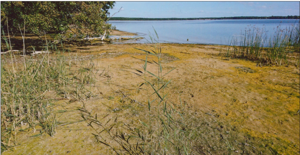
Abb. 4: Trockengefallener Röhrichtgürtel mit Restvorkommen von Phragmites australis (Vordergrund) und Schoenoplectus lacustris (rechts hinten) am Westufer des Arendsees, 14.09.2019.