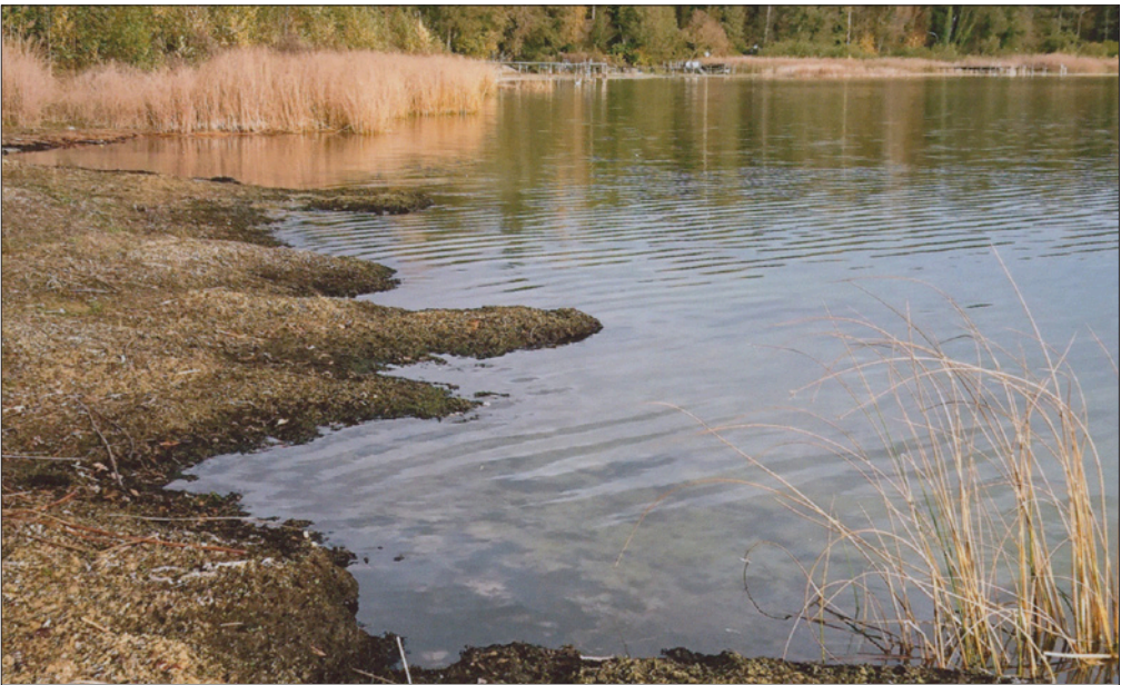
Abb. 8: Bereich mit abgestorbenem Typha angustifolia -Röhricht am Westufer des Arendsees, das widerstandsfähige, zungenartig in das Gewässer vorgedrungene Rhizomgeflecht noch gut erkennbar, 11.11.2022.

Am flachen Nordufer (Abschnitte G und H) wird der Sanduntergrund meist von organischen Sedimenten bedeckt und das Rhizomgeflecht des Rohrkolbens ist wesentlich weitläufiger. Dementsprechend werden Fehlstellen auch zügiger besiedelt, vorwiegend von Bidens tripartita , Lycopus europaeus , Mentha aquatica und Rumex maritimus (Abb. 9). Diese Bereiche und die Ränder noch intakter Rohrkolbenbestände werden stark vom Schwarzwild frequentiert und großflächig umgebrochen.