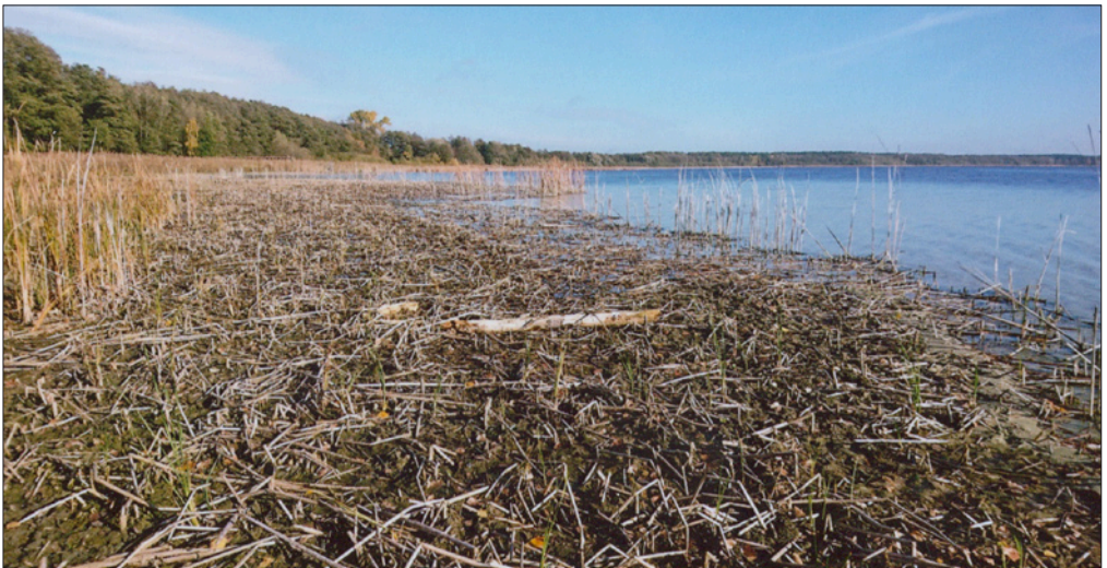
Abb. 6: Trockengefallenes und abgestorbenes Typha angustifolia -Röhrriech am Nordufer des Arendsees, 05.11.2020.