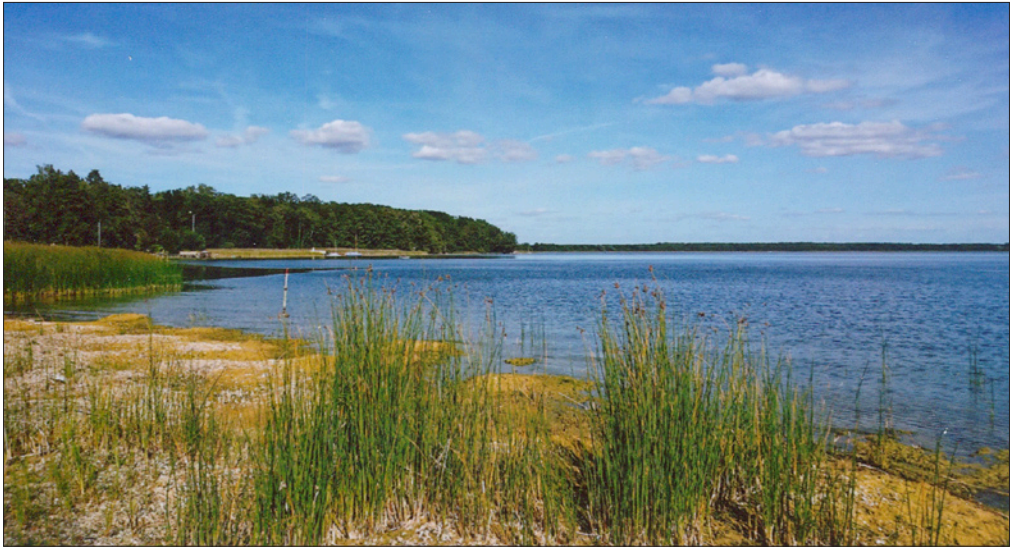
Abb. 5: Abgestorbenes Scirpetum lacustris am Westufer des Arendsees mit Restbeständen der Leitart, 14.09.2019.

Partien bereits flächendeckend mit den bereits genannten und weiteren Arten (z. B. Sonchus asper , S. oleraceus ) bewachsen waren. Selbst am 23.09.2022 wies die Rhizomdecke erst einen schütterten Bewuchs auf. Daran beteiligt waren: Bidens cernua , B. tripartita , Eleocharis acicularis (zus. 8 m 2 ), E. vulgaris agg., Chenopodium rubrum , Epilobium lamyi , E. parviflorum , E. tetragonum , Gnaphalium uliginosum , Juncus bufonius , J. articulatus , J. effusus , J. inflexus , Mentha aquatica , Rorippa sylvestris , Rumex maritimus , Senecio inaequidens (1 Ex.) u. a. Auch an anderen Stellen kam es zu ähnlichen Beobachtungen, so traten z. B. weiter nördlich nochmals mehrere Rasen von Eleocharis acicularis (zus. 10 m 2 ) auf.