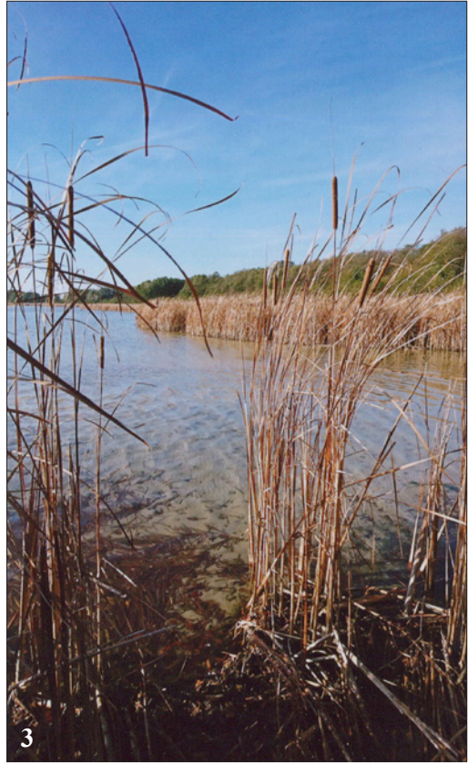
Abb. 2: Trupp von Schoenoplectus lacustris am Westufer des Arendsees, 14.09.2019. Abb. 3: Bereits lückige Röhrichtzone aus Typha angustifolia am Nordufer des Arendsees, 31.10.2019.