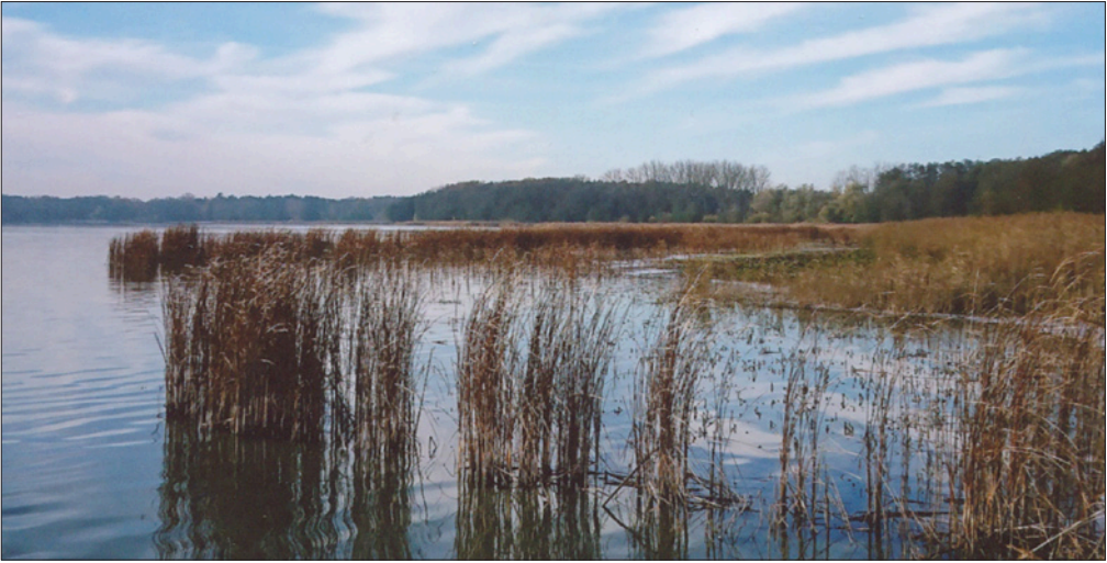
Abb. 7: Bereits lückiges, aber noch überstautes Typha angustifolia -Röhricht am Nordufer des Arendsees, 10.11.2021.