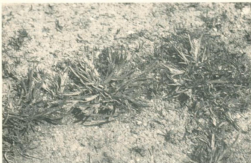
Abb. 1 bis 2. Sclerochloa-Polygonetum avicularis unter der „Höll“ bei Siefersheim (Rhh.), 8. 5. 1966