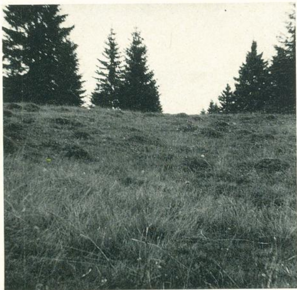
Photo 3. Physionomie générale du Nardetum jurassicum genistetosum. Pâturages boisés peu traités du Haut-Jura neuchâtelais, 1180 m. Nardaie en mosaïque avec présence de «teumons»

ment de substitution de l'Abieti-Fagetum, voire éventuellement de l'Equiseto-Abietetum dans son facies le plus humide. Parmi les espèces représentatives du groupement, citons: Plantago lanceolata et media , Trifolium pratense , repens , montanum , Rhinanthus ssp., Hieracium pilosella , Hypericum maculatum , Sanguisorba minor , Solidago virga-aurea et Succisa pratensis . Le groupement se situe à l'étage montagnard (1000—1300 m.) et correspond à de maigres pâturages boisés peu soignés ou abandonnés avec de nombreux «teumons» 1) (photo 3). La pâture négligée se reboise spontanément, elle est