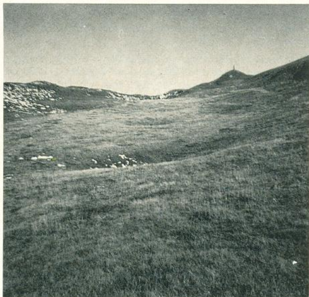
Photo 1. Physionomie générale du Nardetum jurassicum violetosum. Nunatak du Reculet, 1660 m. Roches marno-calcaires (Séquanien)

ment sur des roches calcaires compactes (Kiméridgien) dont le sol est formé essentiellement d'argiles de décalcification. D'une manière générale, le mode d'altération des roches carbonatées joue ici un rôle différenciateur important et pourrait expliquer partiellement la localisation des différents types de nardaié du Jura (fig. 1). Le groupement se développe de façon optimale entre 1500—1700 m. d'altitude, dans la chaîne du Reculet (Jura méridional), c'est-à-dire dans une région formant un nunatak émergeant de la calotte glaciaire jurassienne (AUBERT 1965).