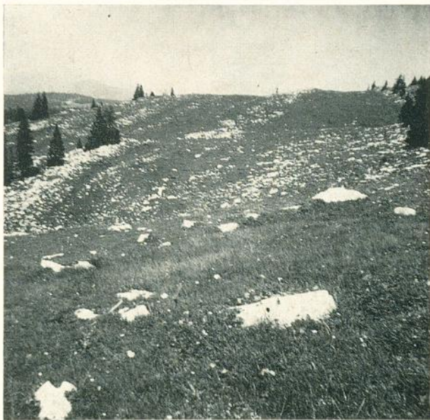
Photo 2. Physionomie générale du Nardetum jurassicum gentianetosum . «Jura rocheux» correspondant à la calotte glaciaire jurassienne: région du M t Tendre, 1590 m. Roches calcaires (Kiméridgien)

Nous avons déjà parlé précédemment (BEGUIN 1967) de l'importance de la calotte glaciaire jurassienne dans le déterminisme de la végétation. Nous