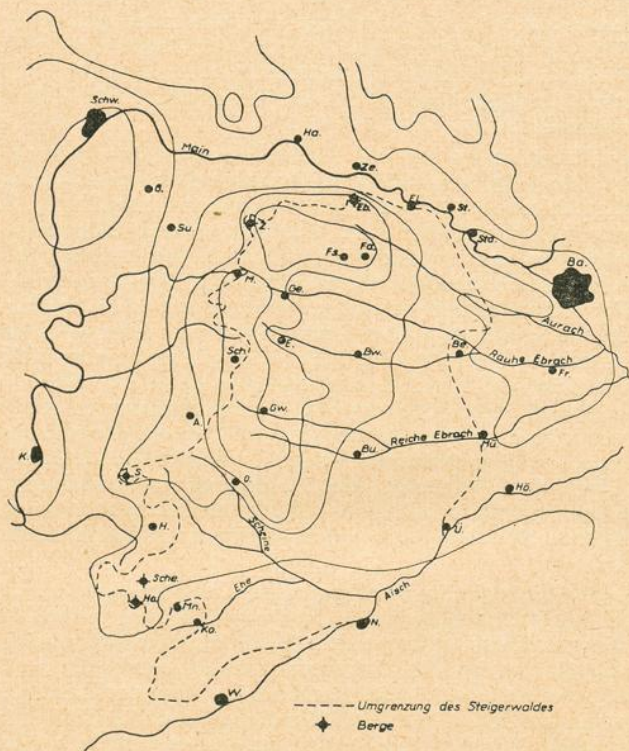
Karte 1. Jahresniederschläge.

im SW der Gipskeuper mehr zur Geltung. Seine lettigen und mergeligen Schichten mit einem mittleren bis hohen Basengehalt ergeben schwere Böden, die bei der langsamen Verwitterung des Gesteins nur wenig entwickelt sind. Auf ihnen ist zwar die Buche gegenüber der Eiche im Nachteil, doch finden wir sie dort auch auf den lehmig-sandigen Böden nicht in größerer Zahl. Wohl aber hat im N-Steigerwald auch das Gestein einen Einfluß auf die Waldzusammensetzung des W- und O-Teiles. Hier, auf den leichteren, mineralstoffärmeren Böden waren die anspruchsloseren Bäume Eiche, Winter-