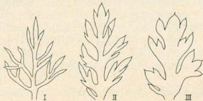
Abb. 1. Blattfiedern von Achillea setacea (I), A. millefolium ssp. collina (II) und ssp. pannonica (III). Jeweils 5. Stengelblatt von oben und 5. Fieder von oben in 5facher Vergrößerung.

Die Fiedern 1. Ordnung sind ähnlich aufgebaut. Bei den Stengelblättern von A. setacea sind die Fiederchen des untersten Paares fast so lang wie der Rest der Fieder oder länger als die halbe Fiederspindel. Bei den Sippen von A. millefolium sind diese Fiederchen kürzer als die halbe Blattspindel.