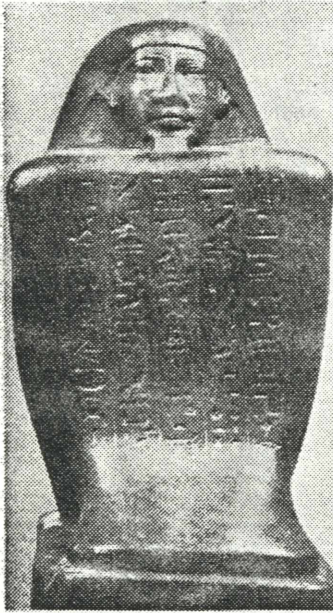
Würfelhocker des Ypi, Spätzeit (grüner Schiefer). Aus dem Louvre, Paris.

Nach dem großen Erfolg der Mexiko-Ausstellung vor zwei Jahren ist heuer ab 9. April die pharaonische Hochkultur des alten Ägypten zu Gast im Linzer Schloßmuseum.