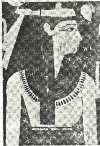
Ausschnitt aus dem Grab des Sen-Nefer, 18. Dynastie, Theben-West

Die Vorstellungen vom Tode und seiner Überwindung finden ihren farbenprächtigen Ausdruck in