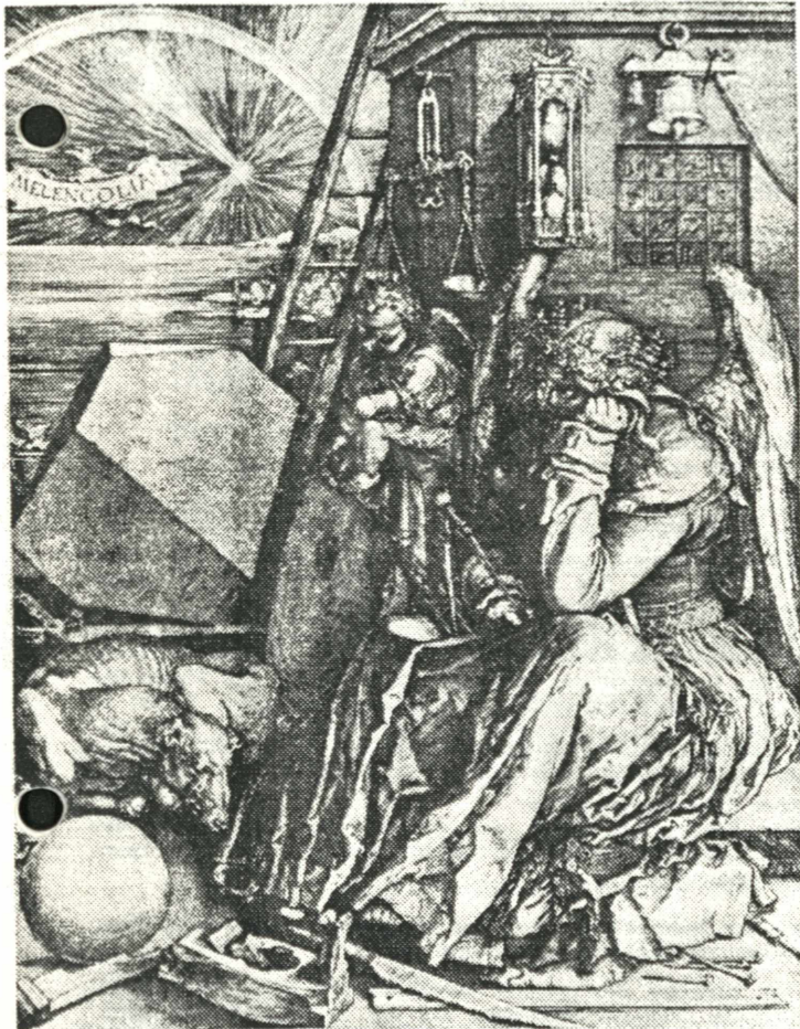
Albrecht Dürer, „Melencolia“, Kupferstich, Albertina

Der allmählich näherrückende Eröffnungstermin der diesjährigen Landesausstellung „Die Botschaft der Graphik“ im Stift Lambach am 20. Mai macht sich nicht nur in einer emsigen Restaurierungstätigkeit in den Ausstellungsräumen bemerkbar. Auch die zu erwartende Fülle von Vorinformationen hat mit der Herausgabe des Faltprospektes zum Inhalt der Ausstellung ihren Anfang genommen. Schwerpunkt nimmt darin eine Skizzierung der in der breiten Öffentlichkeit eher unbekannteren Kupferstichsammlung des Benediktinerstiftes ein, die zu den bedeutendsten in Österreich zählt. Es ist dies auch die Basis dafür,