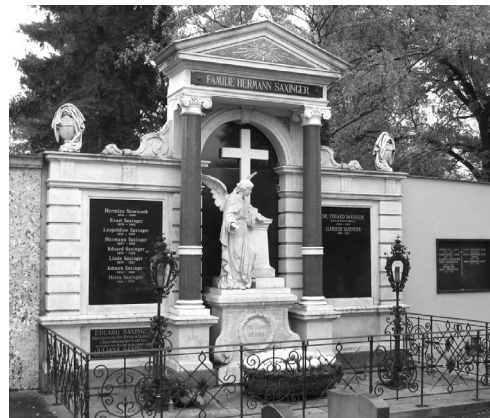
Barbarafriedhof, Grab der Familie Hermann Saxinger