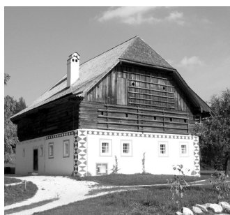
Altmünster „Eggerhaus“

Exkursion: Landesausstellung „Salzkammergut“