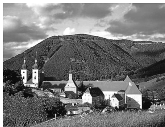
Stift St. Lambrecht

Fahrtkosten: Mitglieder € 40 bzw. Gäste € 43