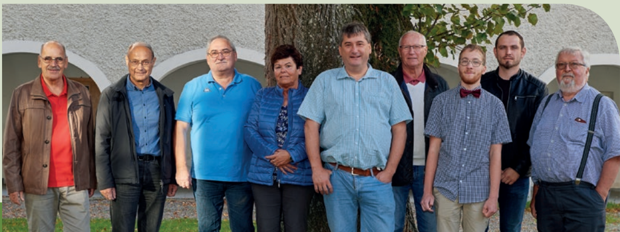
DAS EHRENAMTLICHE TEAM RUND UM NOSTALGIEBILD.AT

ven ankaufen. Mit diesen historischen „Schätzen“ für die Regionalgeschichte und Heimatforschung begann ein ganz neuer Abschnitt für die Geschichte der Photographischen Sammlungen in Oberösterreich. Eine nicht ganz neue Idee, digitalisierte Photographien, Urkunden, Ansichtskarten, Sterbebilder und dergleichen über Internetplattformen öffentlich zur Verfügung zu stellen wurde aufgegriffen um erstmals oberösterreichweit Bildmaterial zu veröffentlichen. Von den beiden Vereinen wurde ein Projekt ins Leben gerufen, welches das Digitalisieren, Archivieren, Beschlagworten der neu erworbenen Photographien und schließlich das Veröffentlichlichen ausgewählter Bilder auf www.nostalgiebild.at zum Inhalt hat.