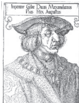
KAISER MAXIMILIAN I.

Nach der gemeinsamen Fahrt über Linz nach Wels, besichtigen wir die Maximilian-Ausstellung in der Burg Wels. Anschließend erwartet Sie die Stadtführung „Auf den Spuren der Polheimer“, welche uns zur Polheimer Stadtburg, dem Minoritenkloster sowie den Polheimer