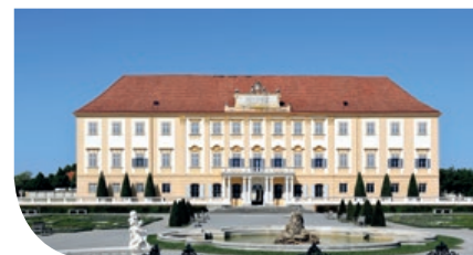
SCHLOSS HOF IST DAS GRÖSSTE DER SECHS MARCHFELDSCHLÖSSER.