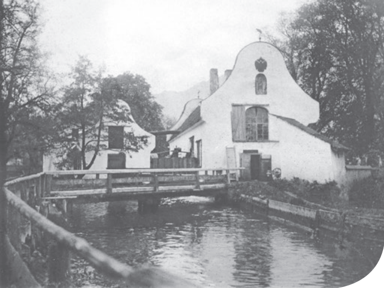
STEINHUBERHAMMER MIT FLUDER, FOTO VOR 1900

dem Melcherhammer konnte über ein seitliches Entlastungswehr mittels einer „Falln“, einer regulierbaren Wehrschütze, Wasser ins natürliche Bachgerinne abgeleitet werden. Das Betriebswasser wurde, durch einen „Grobrechen“ gereinigt, in einer hölzernen Fluderstraße weiter bis über die „Radstube“ zwischen den beiden Werksgebäuden des Melcherhammers geführt. Der Fluder erreichte hier eine Breite von 4,80 Metern bei einer Tiefe von 1,35 Metern und konnte bis zu sieben in der Radstube befindliche, oberflächliche Wasserräder antreiben.