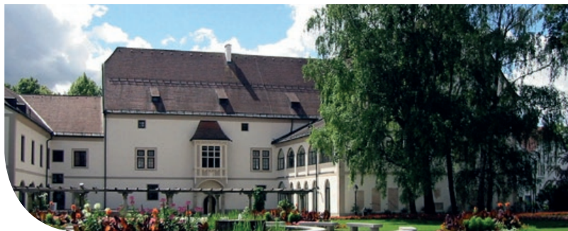
BLICK AUF DIE BURG WELS

Nach einer Mittagspause folgt die Fahrt nach Pollham zu den Burghügeln der Polheimer Stamm-