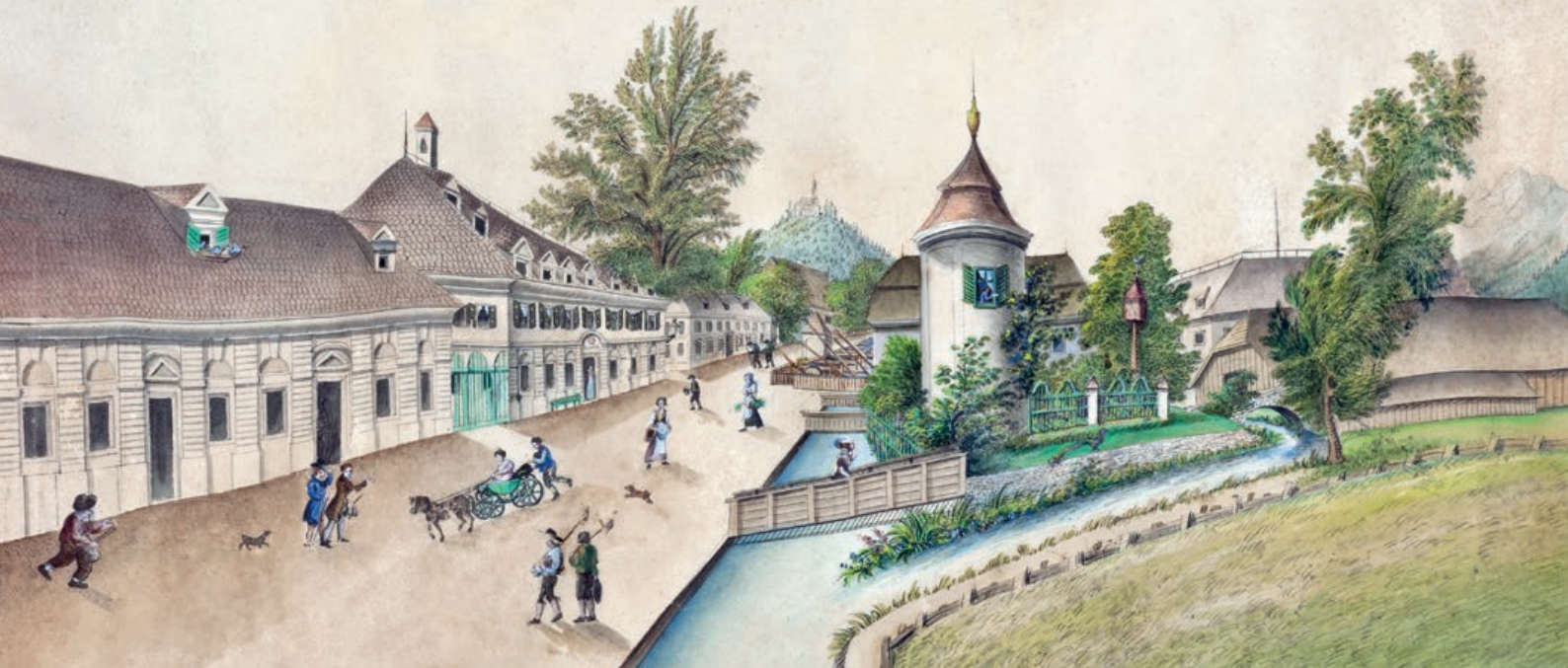
„DIE SENSenschMIEDTEREI UND OECONOMIE GEBÄUDE-ANLAGE DES HERRN KASPAR ZEITLINGER ZU MICHELDORF.“ VORLAGE FÜR LITHOGRAPHIE, JOS. LÖW, 1832

Die Wiederbelebung des Micheldorfer Sensenschmiedemuseums