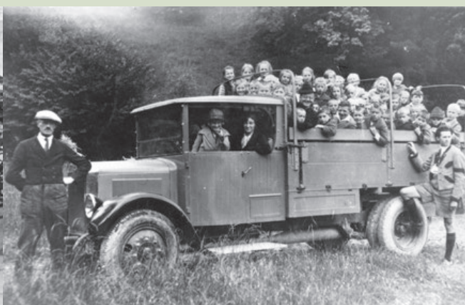
KLOSTER WAIZENKIRCHEN