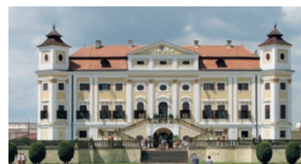
SCHLOSS MILOTICE IM MÁHRISCHEN OKRES HODONÍN, TSCHECHIEN