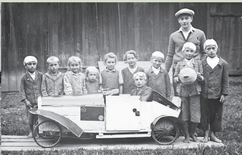
THEATER BURSCHENVEREIN WAIZENKIRCHEN UND EIN SEIFENKISTENAUTO UM 1930

Nach tausenden ehrenamtlichen Stunden kann jetzt auf ein digitales Archiv von rund 450.000 Bildern zurückgegriffen werden. Seit dem Vorjahr können Interessierte in aktuell rund 20.000 Bildern online schmökern. Vor allem die Reportagen beispielsweise über Glockenweißen, Vereinsfeste, Primizen, Eröffnungen, Gemeinde- und Pfarrfeste und vieles mehr stellen für die Regional- und Heimatforschung einen vielfältigen Fundus für die eigene Forschungs- und Publikationstätigkeit dar.