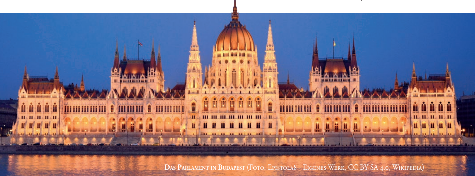
DAS PARLAMENT IN BUDAPEST

ANMELDUNG: Reisebüro Neubauer, siehe Seite 27