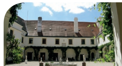
INNENHOF VON SCHLOSS LOOSDORF

ANMELDUNG: Reisebüro Neubauer, siehe unten