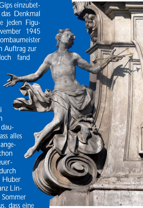
Abb. 7: Dreifaltigkeitssäule Linz (wie Abb. 1), Hl. Sebastian