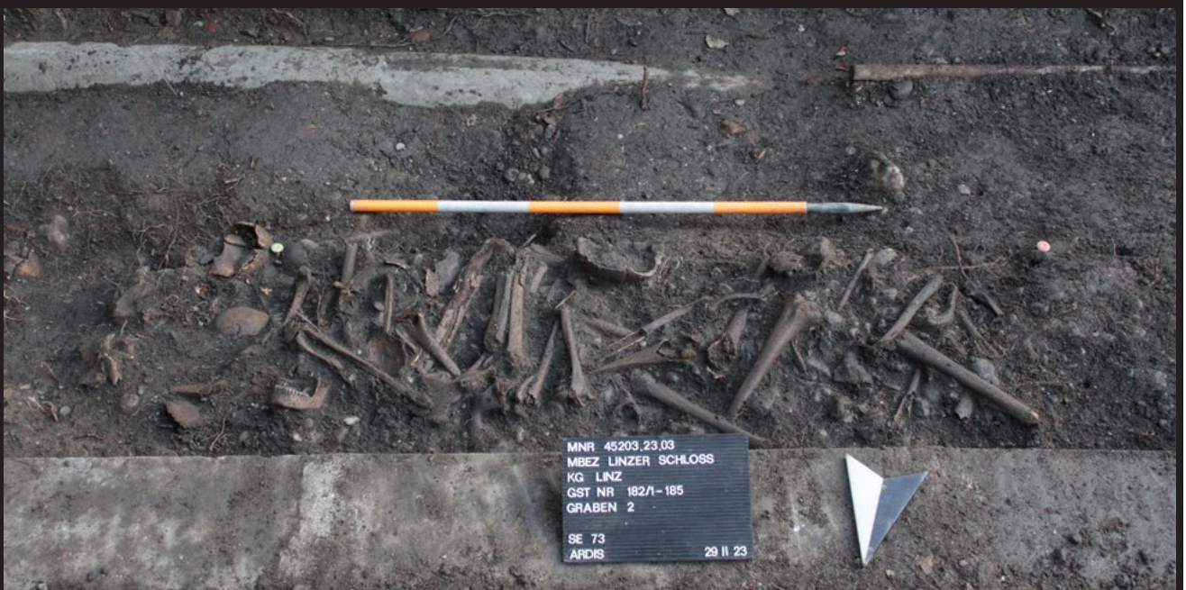
Abb. 6: Diese menschlichen Überreste sind in eine Holzkiste (Ossuarium) geschichtet worden. Das Holz wurde im Laufe der Zeit zersetzt, die geschichteten Knochen blieben erhalten.