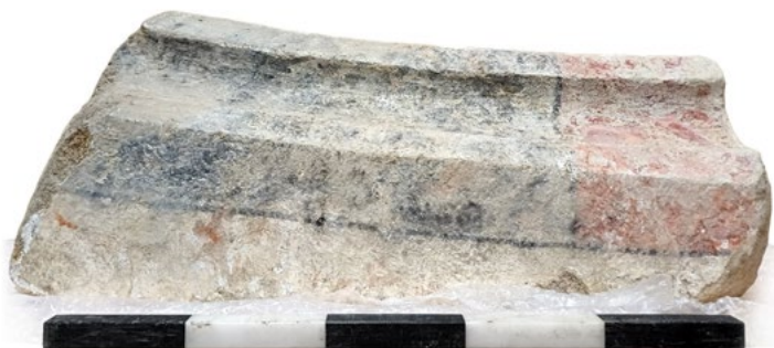
Abb. 2: Farblich gefasstes Fragment eines massiven Steinbogens, das wahrscheinlich von der 1599 abgetragenen St. Gangolph-Kirche stammt

Im großen Schlosshof sind weitere Mauern und ein Graben angeschnitten worden, die entweder zur mittelalterlichen Burg gehört haben oder sogar noch älter sind. Als besonders spektakulär hat sich ein ca. 6 Meter langer und bis zu 1,5 Meter breiter Schnitt erwiesen. Dieser musste in einem Bereich angelegt werden, wo bereits auf Grund älterer Ausgrabungen mit dem Schlossfriedhof zu rechnen war. In diesem kleinen Bereich wurden 19 Gräber (Abb. 3–5) sowie die Überreste von mindestens