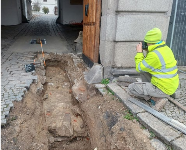
Abb. 1: Mitarbeiterin der Grabungsrma ARDIS bei der Dokumentation des Fundamentes des Rudolfstores. Im Vordergrund ist das Bogenfragment zu sehen

einem Ossuarium, also einer „Knochenkiste“, mit den Gebeinen weiterer Individuen geborgen (Abb. 6). Andere Skelette waren von früheren Bodeneingriffen gestört und deshalb nur noch partiell erhalten.