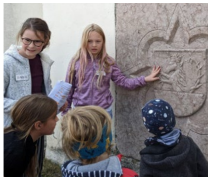
Führungen von Kindern für Kinder werden in der Starhembergkapelle und Gruft in der Pfarrkirche Hellmonsödt angeboten.

MÜHLVIERTEL In Hellmonsödt kann man am 19. Mai 2024 in die neuzeitliche Geschichte eintauchen: Bei der Eröffnung der Jahresausstellung Hexen – Magie und Aberglaube erfährt man hier Spannendes über Rituale, Volksbräuche und Aberglauben zu vergangenen Zeiten. Die feierliche Eröffnung bietet jedoch nicht nur eine perfekte Gelegenheit zum Ausstellungsbesuch, sondern