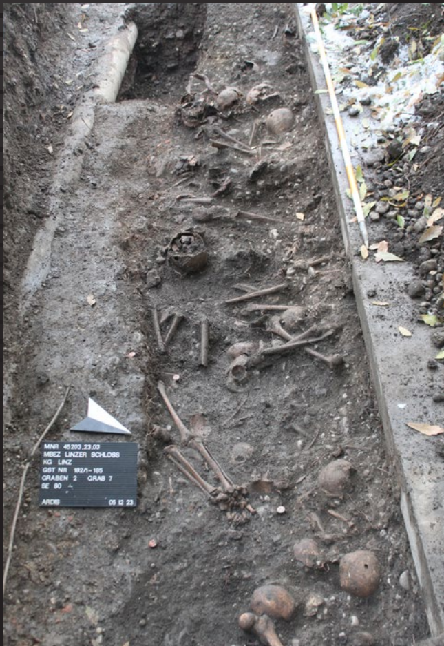
Abb. 4: In einem kleinen Schnitt im Innenhof wurden insgesamt 19 Gräber und die Überreste von zahlreichen weiteren menschlichen Skeletten dokumentiert und geborgen. Ein Kanal (links) und eine Leitungsabdeckung (rechts) zeugen von früheren Eingriffen in diesem Gräberfeld.