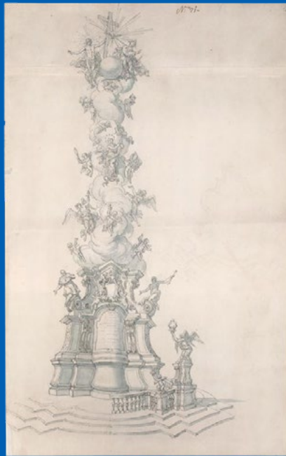
Abb. 2: Antonio Beduzzi, Entwurfszeichnung für die Linzer Dreifaltigkeitssäule, 1714, 56,3 x 35 cm, Brunn, Mährischen Galerie, Sammlung Grimm, Inv. Nr. B 14751 (Bildzitat aus: Schultes 2023, Abb. 2)

Im Vergleich zu Wien ist das Figurenprogramm in Linz auf das Wesentlichste reduziert (Abb. 1, 3). Das Monument steht auf einem Granitsockel mit elf (ursprünglich