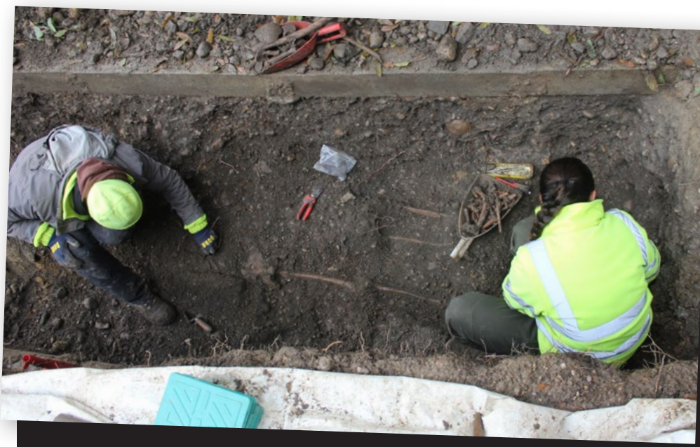
Abb. 3: Mitarbeiterinnen der Grabungsfirma ARDIS bei der Freilegung von Skeletten im großen Innenhof