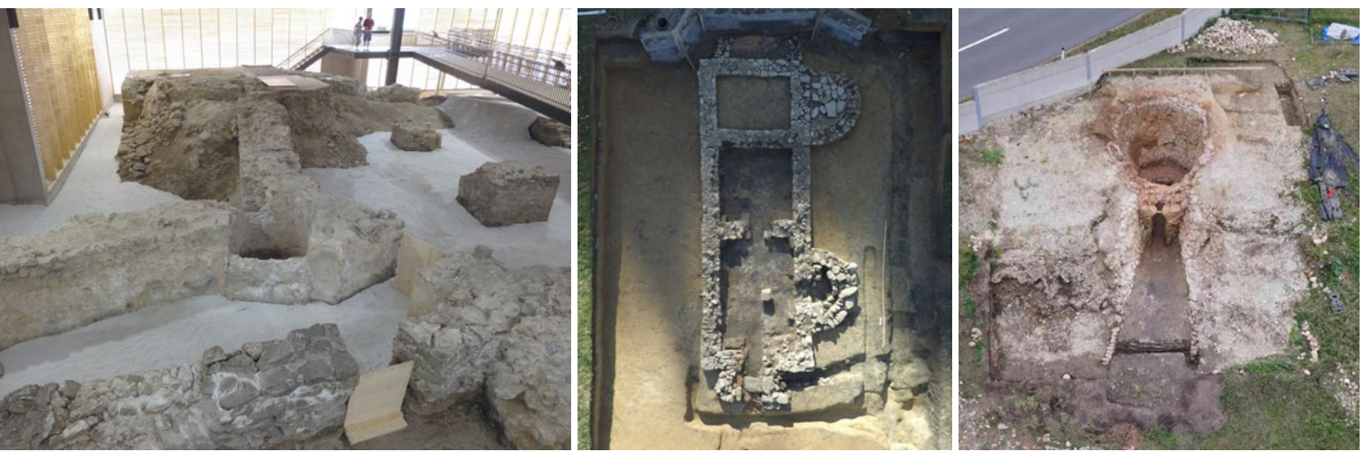
Abb. 1: Die erste Komponente des Donaulimes Abb.3: Das Luftbild zeigt ein römisches Bad Abb. 4: Der römische Kalkbrennofen im Nahbereich in Österreich ist das Kleinkastell von Oberrain; seiner typischer Bauweise und Aufteilung undes Legionslagers ist als Teil einer ganzen Offensiv in Engelhartzell, in diesem Fall ein sogenannt bezeigt somit die „römischen“ Annehmlichkeiten in außergewöhnliches Zeichen der römischen Quadriburgus. (Foto: Emmerich Weinlich) auch am Rande des Reiches. (Foto: OÖLKGWirtschaftsgeschichte. (Foto: Richard Koch)

ten Veranstaltungen, wie sie etwa zum Welterbetag angeboten werden, oder Vermittlungsprogrammen in Schulen.