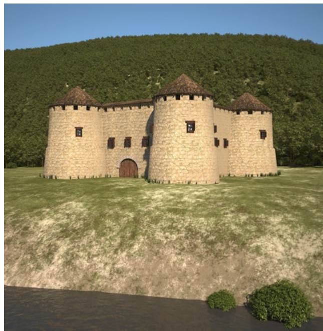
Abb.5: Die Visualisierung der Kalkbrennöfen gibt uns eine Vorstellung von der Dimension der bereits industriell laufenden Kalkbrennerei in Enns. (Visualisierung: 7reasons)