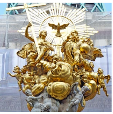
Abb. 5: Dreifaltigkeitssäule Wien (wie Abb. 3), Dreifaltigkeitsgruppe