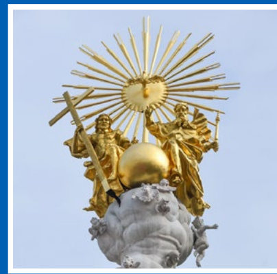
Abb. 4: Dreifaltigkeitssäule Linz (wie Abb. 1), Dreifaltigkeitsgruppe nach Restaurierung 2020

Stumpfegger war in Oberndorf auch mit der Anlage des Kalvarienbergs betraut. Das Ensemble besteht aus einer 1720 datierten Marmorgur des hl. Johann Nepomuk, deren begleitende Putten sich gut mit jenen der Linzer Säule vergleichen lassen. Eine Freitreppe führt vom Salzachufer zu einer halboffenen Kapelle mit der geschnittenen, 1721 entstandenen Kreuzigungsgruppe. Der Name des Bildhauers wird nicht genannt, doch sprechen die Entstehungsumstände eindeutig für Pfänger. Die ausdrucksvolle Komposition der Gruppe legt zudem nahe, dass auch ihr ein Entwurf Beduzzis zugrunde lag. Dafür spricht vor allem der gute Schächer, der, himmelwärts blickend, die Arme in Verzückung ausbreitet und darin außerdem an den Linzer hl. Sebastian erinnert (Abb. 6, 7). Anschließend schuf Pfänger die Statuen am linken vorderen Seitenaltar sowie mehrere Nischenfiguren in den Kapellen der Salzburger Kollegienkirche, von denen sich vor allem der hl. Johann Nepomuk mit dem Linzer Sebastian vergleichen lässt. Spätere Arbeiten kommen nicht mehr für einen Vergleich in Frage. Zu erwähnen ist, dass Pfänger 1738 in der Pfarrkirche von Salzburg-Gnigl neuerlich mit Sebastian Stumpfegger zusammenarbeitete. Zum Vergleich dient diesbezüglich die Figur des hl. Georg, der elegant auf dem lächerlich kleinen Drachen balanciert. Von den Spätwerken sei hier nur die 1754 datierte Büste des hl. Sebastian am Portal