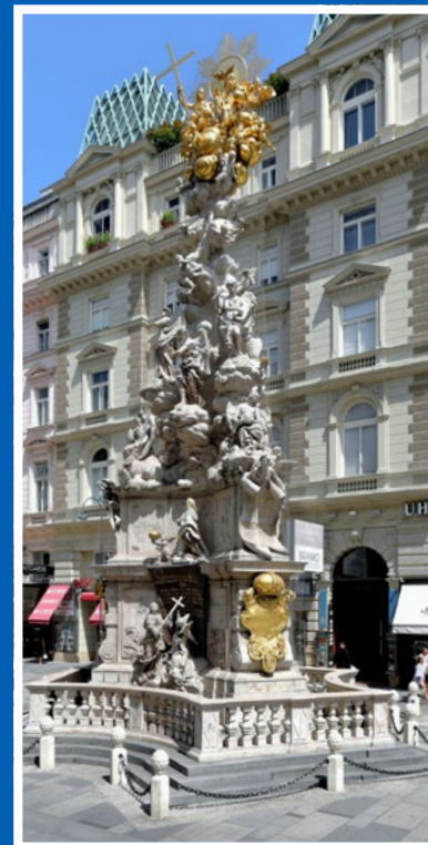
Abb. 3: Johann Bernhard Fischer von Erlach, Lodovico Ottavio Burnacini, Matthias Rauchmiller, Paul Strudel u. a., Dreifaltigkeitssäule, 1679–1694, Wien, Graben