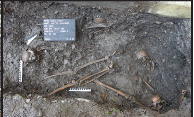
Abb. 5: Auf dem Schlossfriedhof liegen die Bestattungen in mehreren Schichten übereinander.