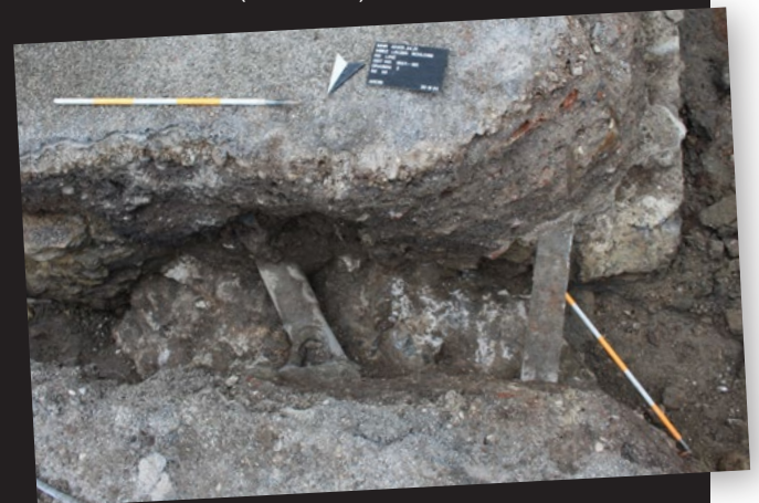
Abb. 8: Im Bereich der Terrasse des Schlosscafes kamen mehrere Mauerzüge zum Vorschein. Die schmale Mauer rechts im Bild überlagert ein älteres, diagonal dazu laufendes Fundament mit einer Stärke von ca. 2m.