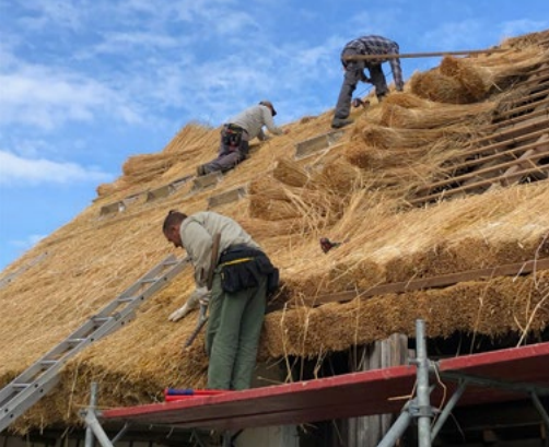
Ein neues Strohdach für das Freilichtmuseum Pelmberg.

19. Mai 2024 und laufende Führungsangebote an weiteren Öntungstagen im Aktionszeitraum eine gute Gelegenheit, um die umfassend neu sanierte Leharvilla zu erkunden. Die Villa, die dem Komponisten Franz Lehár als Sommerfrischeort diente, war nach dem Tod des „Operettenkönigs“ 1948 unter Auagen der Stadtgemeinde Bad Ischl vermacht worden. Das Haus sollte der Öentlichkeit in unverändertem Zustand zugänglich gemacht werden. An dem bereits ab 1949 als Museum geführten Haus waren in den letzten Jahren Restaurierungs- und Sanierungsarbeiten unabdinglich geworden. Im Zuge der Kulturhauptstadt Salzkammergut 2024 wird das nunmehr generalsanierte Haus ab Mai 2024 wieder für Besucherinnen und Besucher geönet.