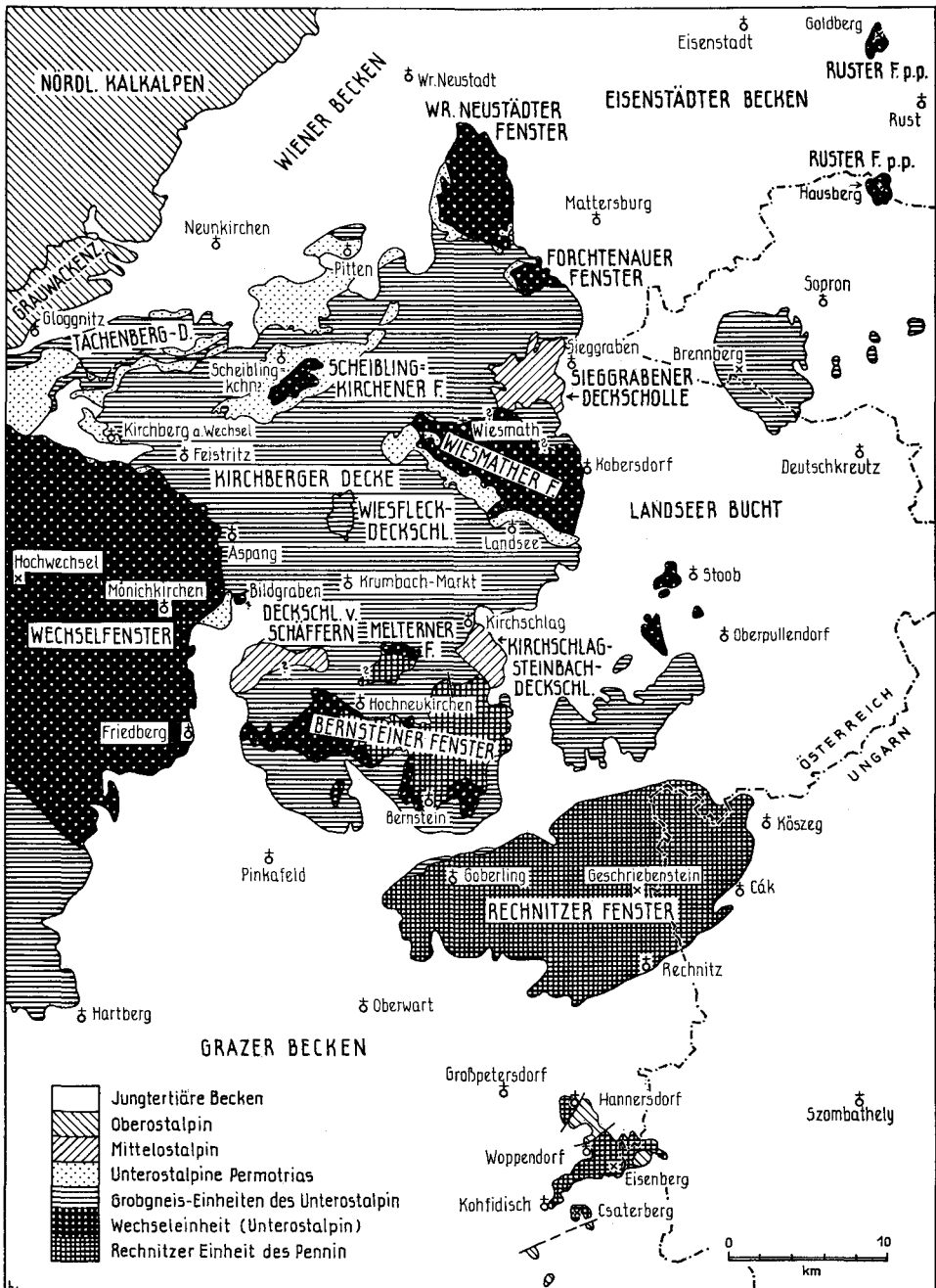
Abb. 1: Die Fenster von penninischer Rechnitzer- und unterostalpinischer Wechselserie am Ostrand der Alpen.