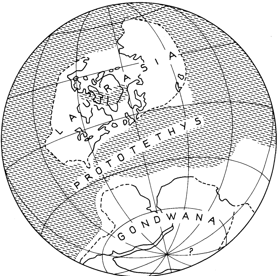
Abb. 4: Die Prototethys im späten Devon; nach E. IRVING, 1979, Abb. 7.

Im Gegensatz zu dieser nicht gerechtfertigten nomenklatorischen Aufspaltung des Tethys-Begriffes in zeitlicher oder räumlicher Hinsicht wäre der Begriff Prototethys für das altpaläozoische variszische Mittelmeer (Abb. 4) durchaus angebracht, da dieses genetisch, räumlich und zeitlich von der Tethys völlig unabhängig ist. Der Begriff geht auf J. DEWEY & J. BIRD (1970) zurück, die diesen Namen ursprünglich nur für das ordovicische breite Meer im mobilen Gürtel zwischen der Laurentischen,