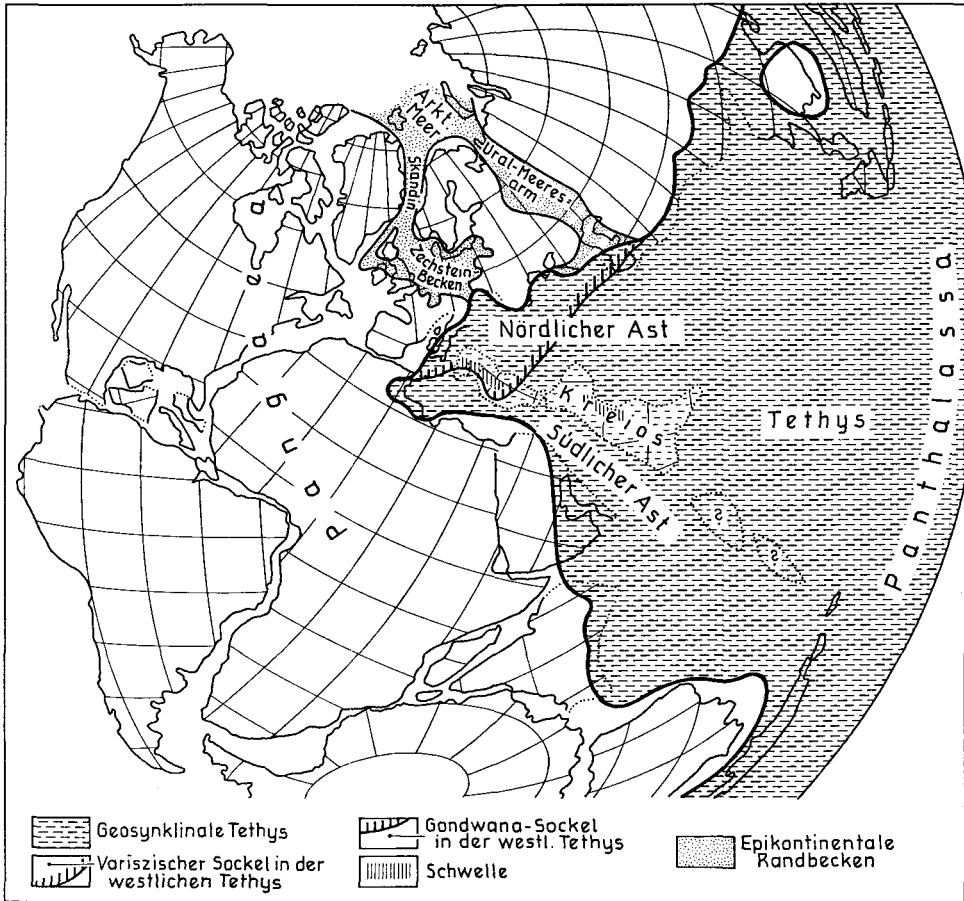
Abb. 1: Die Tethys im höheren Perm. Die Rekonstruktion der Pangaea ist unter Berücksichtigung der Angaben von A. HALLAM (1983) durchgeführt.

LER, 1980, Abb. 2; 1982, S. 46, Taf. 14) und weiter über das Nordatlantische Rift (Skandinavisches Meer) zur Arktic. Die Verbindung aus der Tethys zum regressiven epikontinentalen Zechstein-Becken in Mitteleuropa verlief (wie auch später in der Trias) über die Schlesische Pforte in Südpolen, von wo T. & D. PERYT (1977) den Einfluß der permischen Tethysmikrofaunen in jenen des deutschen Zechsteins beschrieben haben (vgl. Abb. 1).