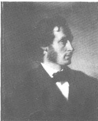
PROF. EDUARD SUESS GEOLOGE 75. TODESTAG