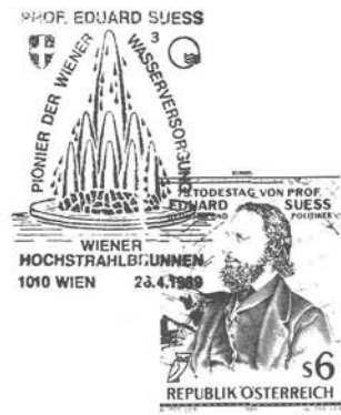
Abb. 7: Endgültiger Entwurf der Eduard-Suess-Marke von Werner Pfeiler mit den Sonderstempeln der drei Sonderpostämter.