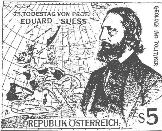
Abb. 6: Ursprünglicher Entwurf der Sonderpostmarke für Eduard Suess von A. Tollmann. Die Marke sollte den Meister und sein Werk, nämlich den europäischen Ausschnitt des „Antlitz der Erde“ zeigen.