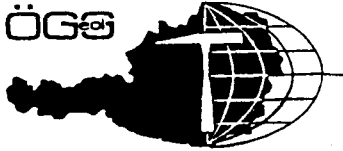
Österreichische Geologische Gesellschaft