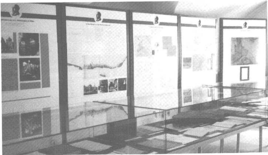
Abb. 2: Ausschnitt aus der Gedenkausstellung in Marz.