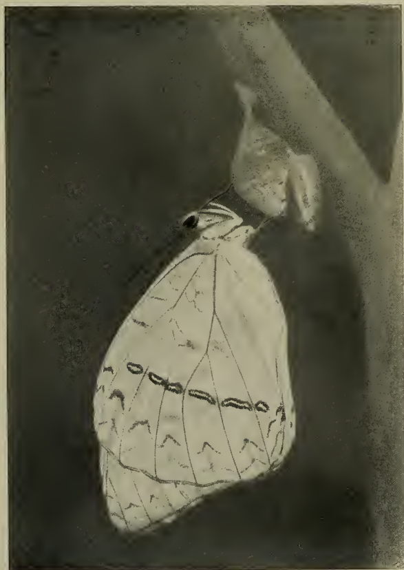
Frisch geschlüpfter Falter, an der Exuvie hängend.