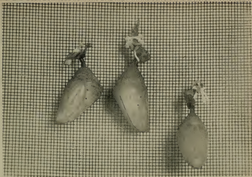
Lebende Puppen von Morpho laertes .