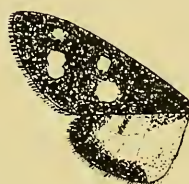
D. famula Frr. f. pseudohyalina m.