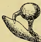
D. punctata F. var. servula Berce. ♂