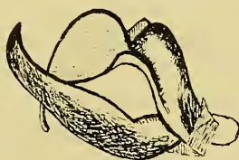
D. famula Frr. f. pseudohyalina m. ♂