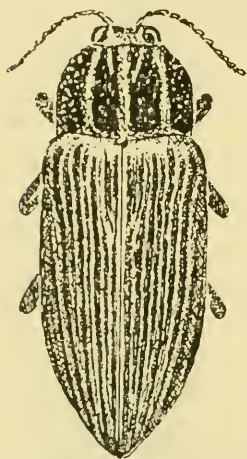
Abb. 3. Freya lampetiformis Théry.

Freya lampetiformis n. sp. (Abb. 3). — Long. 18 mm., larg. 6,5 mm. — Modérément allongé, ayant sa plus grande largeur en arrière, d'un bronzé obscur avec les impressions d'un cuivrex doré, les antennes et genoux teintés de bleu. Tête moyenne, impressionnée en avant, fortement ponctuée, avec une petite bande