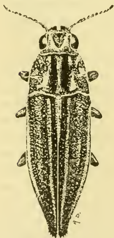
Abb. 2. Cyphogastra Kerremansi ssp. Freyi Théry.

En 1911, Kerremans a décrit sous le nom de arcuaticollis un Cyphogastra nouveau de l'île Woodlark et en a donné la description suivante: »Voisin de canaliculata Théry mais beau-