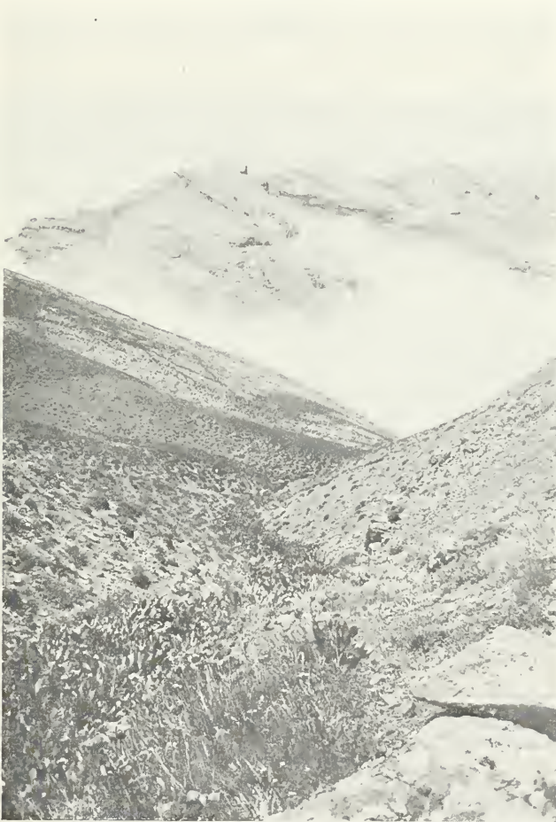
Abb. 1: Habitat von Pr. ( Luc. ) horni Alb. an der Nordseite des Kendevan-Tunnels in ca. 2700 m Höhe. Elburz-Gebirge, Iran.