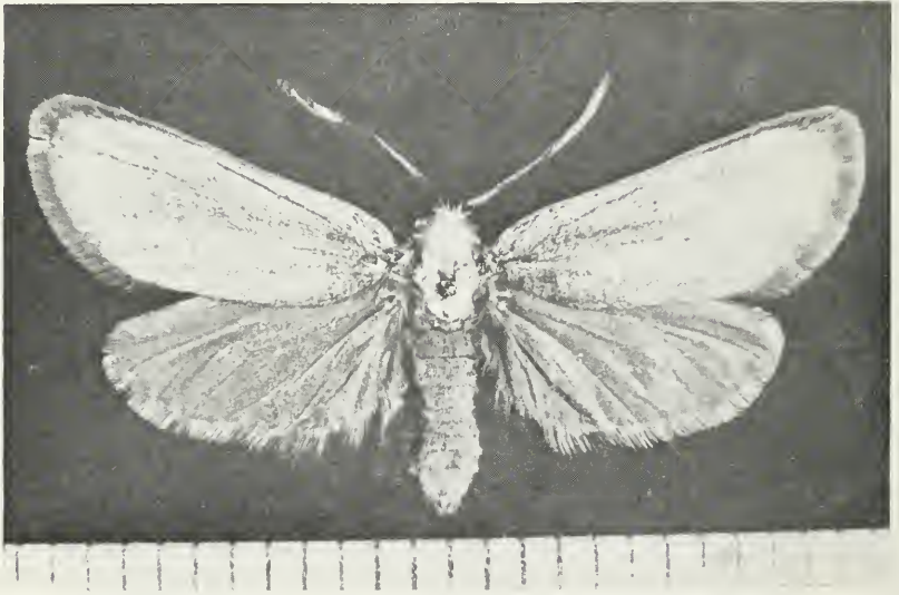
Abb. 2: ♂ von Pr. (Luc.) horni Alb. Iran, Elburz-Gebiet, Polour, 2200—2900 m, 4. bis 6. VII. 1973; leg. Junge, Coll. Junge.