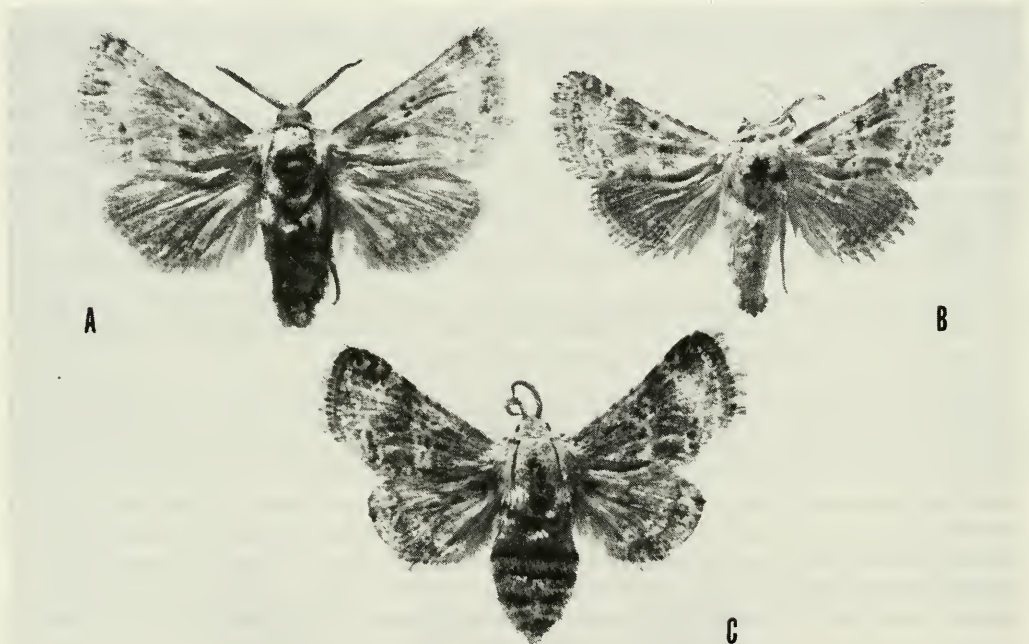
Abb. 1: Stygia mosulensis DANIEL, 1965-♀ ♀; a) N-Iran, Azerbaidjan, Tabriz, 1600 m, 29.7.79, leg. C. Naumann (Gen. Präp. Nr. 2981); b) Irak, Mosul (Wüste), Juni 1935, leg. Wiltshire (Paratypus, Gen. Präp. Nr. 2982); c) Bulgarien, Ograzden Mt., v. Lebnitza, 4.8.86, leg. Ganev (Gen. Präp. Nr. 2980).

Die Verbreitung einer Stygia -Art auf dem südöstlichen Balkan war damit endgültig dokumentiert. Seltsam erscheint lediglich, daß trotz relativ intensiver Erforschung der Nachtfalterfauna des Balkans die Art in den letzten 100 Jahren nicht nachgewiesen werden konnte und nun gelangen gleich zwei Nachweise innerhalb der letzten drei Jahre. Wäre die Art aus Kleinasien bekannt, könnte man an eine rasche Arealerweiterung denken. Nach den bis heute bekannt gewordenen Nachweisen ist es allerdings mehr als wahrscheinlich, daß Stygia mosulensis auch in Kleinasien verbreitet ist.