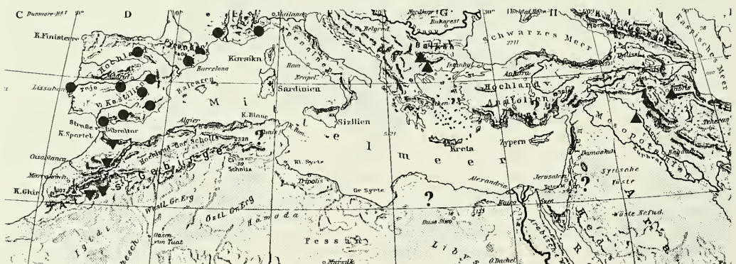
Abb. 9: Verbreitung der Gattung Stygia LATREILLE, 1803:

DANIEL (1965: 80) konnte bei der Beschreibung der S. mosulensis keine stichhaltigen Trennungskriterien gegenüber S. hades anführen: „... recht nahe hades ; ... ebenso gedrungen gebaut wie das ♀ der Vergleichsart; ... Fühler wie hades “ usw.). DANIEL stützt das Artrecht von S. mosulensis ausschließlich auf die hellere Tracht und die seiner Meinung nach extrem disjunkte geographische Verbreitung von