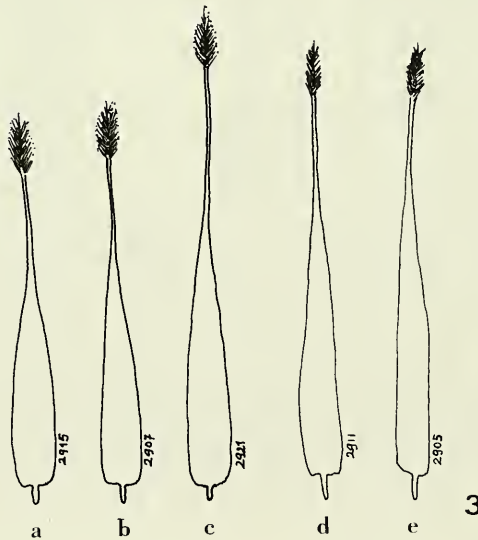
Abb. 3. Androkonium: a) megera australis , Sizilien; b) megera megera , Spanien, Jaen; c) megera lyssa , N-Iran, Elbursgebirge; d) paramegaera intermedia , Ibiza; e) paramegaera paramegaera , Korsika.