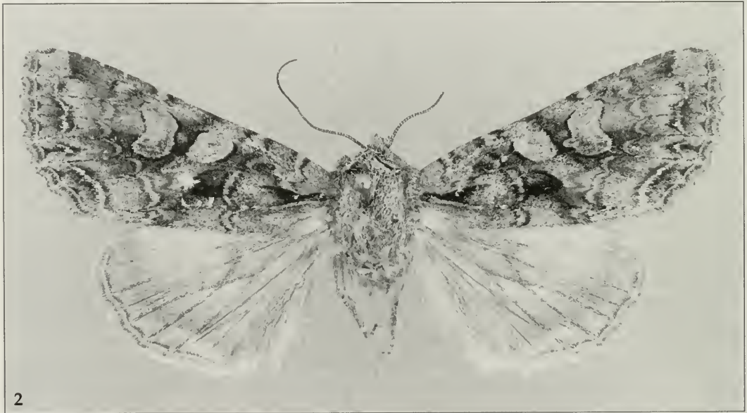
Abb. 1. Melanchra dierli , ♂, HOLOTYPUS.