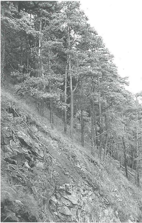
Abb. 3: Kirchkogel II: Föhrenwald am steil abfallenden SW-Hang ohne Unterwuchs.

Begriff Reliktform ist aus der Autökologie der Gattung Pinus zu verstehen. Die Anpassung an konkurrenzarme Gebiete erfolgt vor allem durch Vorsorge gegen Trockenzeiträume. Der niedrige Transpirationskoeffizient des sogenannten pinoiden Blattes, die Fähigkeit der Samen, auch bei kurzen Feuchtperioden zu keimen, und das tiefreichende, zähe Wurzelwerk sind dafür als Ursache zu nennen. Auf diese Weise sind Pinus -Bestände in der Lage, offene Standorte zu besetzen, während sie, ihrem langsameren Wachstum und ihren hohen Lichtansprüchen zufolge konkurrenzmäßig unterlegen, auf besseren Böden vom Laubwald verdrängt werden. Damit stehen primäre Föhrenwälder im Laub- und Laubmischwaldklima Europas heute immer in Rückzugsposition und können daher als Reliktwälder angesehen werden (ZIMMERMANN 1976).