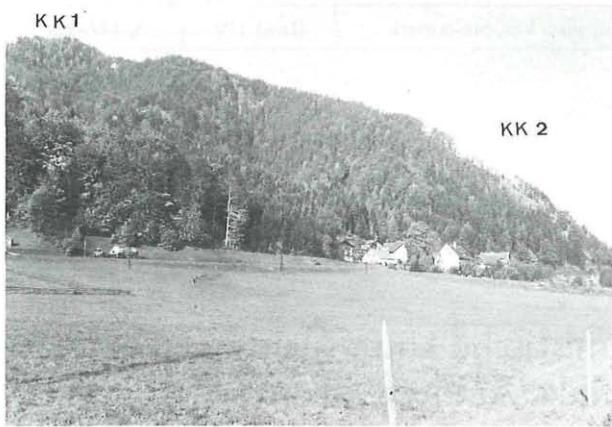
Abb. 1: Blick vom Murtal nach Norden zu den beiden Untersuchungsgebieten am Kirchkogel in 1000 m Höhe (KK I) und 600 m Höhe (KK II).