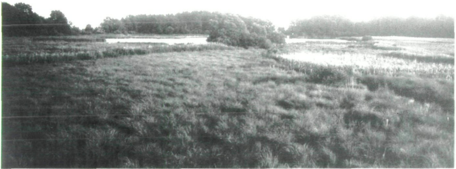
Abb. 1: Fuchsschweifteich bei Neudau

Die Neudauer Fischteiche sind außerdem eines der bedeutendsten Brut- und Rastgebiete für Wasservögel in der Steiermark. Zu den regelmäßigen Brutvögeln zählen gefährdete Arten, wie Haubentaucher ( Podiceps cristatus ), Schwarzhalstaucher ( P. nigricollis ), Tafelente ( Aythya ferina ), Reiherente ( A. fuligula ) und Wasserralle ( Rallus aquaticus ).