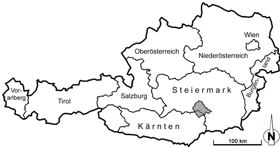
Abb. 1: Die Lage der Stupalpe (Untersuchungsgebiet, grau) in Beziehung zu den Grenzen der Bundesländer Österreichs The Stupalpe (area of investigation in grey colour) in relation to the provincial borders of Austria

Die Abgrenzung der Gebirgsgruppe wird nicht ganz einheitlich vollzogen. Der Südteil wird öfters, insbesondere in der älteren Literatur sowie in naturräumlichen Gliederungsmodellen für das Bundesland Kärnten (z. B. SEGER 1992) unter dem Namen Packalpe als eigene Gebirgsgruppe abgetrennt. Diese Ausscheidung des Südteils ist jedoch geomorphologisch wenig überzeugend. Wir folgen in der Gebietsabgrenzung