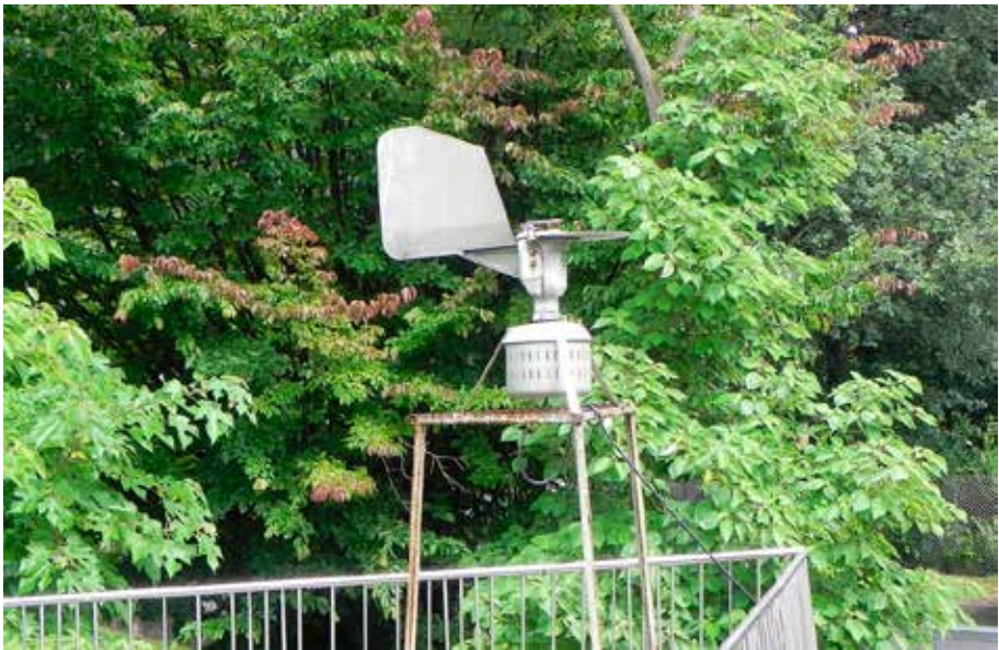
Abb. 1: Die BURKARD-Pollenfalle im Botanischen Garten des Instituts für Pflanzenwissenschaften der Universität Graz auf einer Terrasse an der N-Seite des Temperierthauses der Gewächshausanlage. Im Hintergrund ein Persischer-Eisenholzbaum ( Parrotia persica ) sowie ein männlicher und ein weiblicher Papiermaulbeerbaum ( Broussonetia papyrifera ).

Im Botanischen Garten des Instituts für Pflanzenwissenschaften der Universität Graz befindet sich seit 2001 eine BURKARD-Pollenfalle, die von 2001–2013 auf einer Terrasse an der N-Seite des Temperierthauses der Gewächshausanlage (47°04′55,6″N,