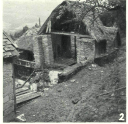
Abb. 2: Durch Rutschung zerstörtes Gehöft Heil in Zeil-Pöllau.