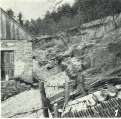
Abb. 1: Rutschung bei Heil in Zeil-Pöllau.