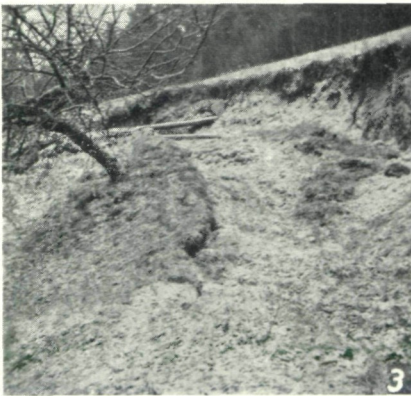
Abb. 3: Rutschungsnische bei Heil in Zeil-Pöllau.