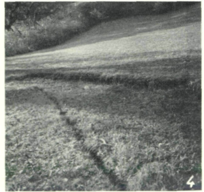
Abb. 4: Abbruchrisse bei Zarka in Löffelberg.