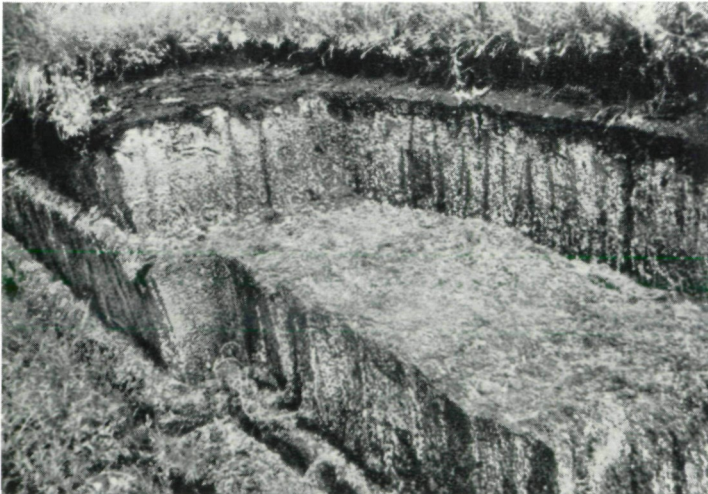
Abb. 2: Teil eines alten, trockenen Torfabstiches an einem Entwässerungsgraben von der Mitte der Abb. 1. Das Boden- bzw. Torfprofil sowie die darauf wachsenden Pflanzengesellschaften sind erst zu untersuchen. phot. J. EGGLER.