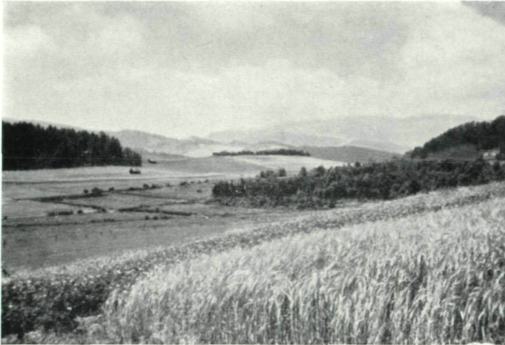
Abb. 1: Blick auf einen Teil des Moorgebietes westlich von Aich. In der Mitte, links, ist zum Teil schon abgebautes Moor. Die geraden dunkleren Streifen sind breite Wassergräben. In der Mitte, rechts, steht Buschwerk und niedriger Wald, das Pino-Betuletum humilis . Dann folgen die teilweise bewaldeten eiszeitlichen Schotterhügel (Gemsenkopf, Obersteiner Kogel u. a.). Im Hintergrunde ist die Grebenzen zu sehen.