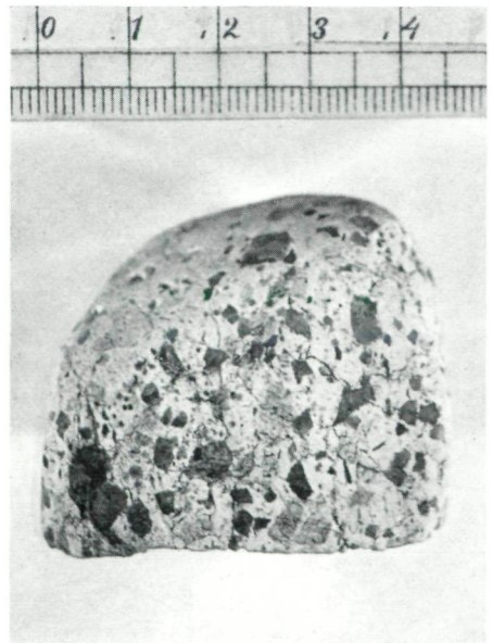
Abb. 3: Weißer Rhyolith (Gerölle) von Saubach bei St. Marein a. P., Oststeiermark. Beachte die zahlreichen dunkelgrauen Quarzeinsprenglinge. Die Feldspateinsprenglinge sind hellfärbig, daher wenig auffällig. Grundmasse weiß, dicht.