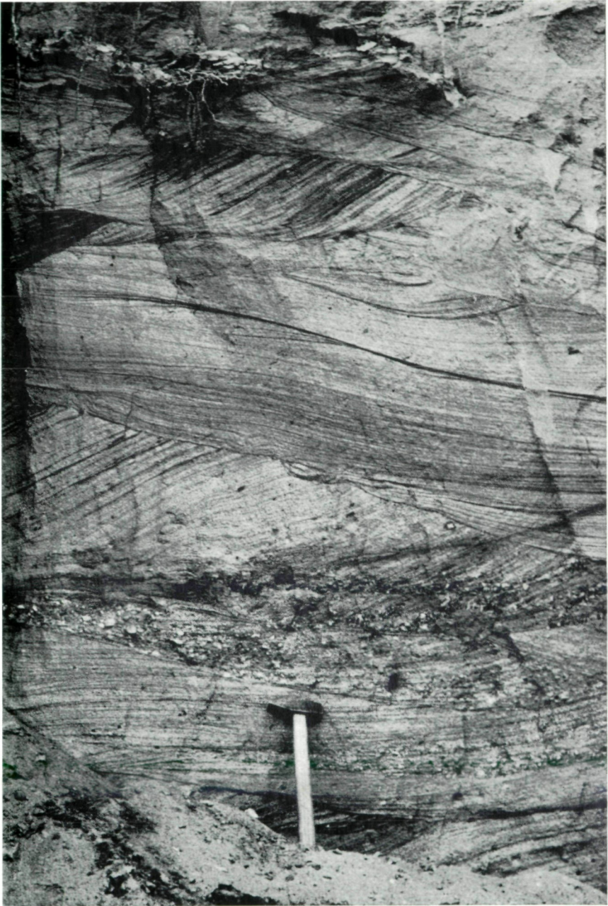
Abb. 1: Sandgrube SUKITSCH in Schützing am Kernerberg, Oststeiermark. Linker Teil der Sandgrubenwand mit einmalig schöner Kreuz- bzw. Schrägschichtung. Beachte auch die Feinschotterlage über dem Hammerkopf im Liegenden der Grubenwand.